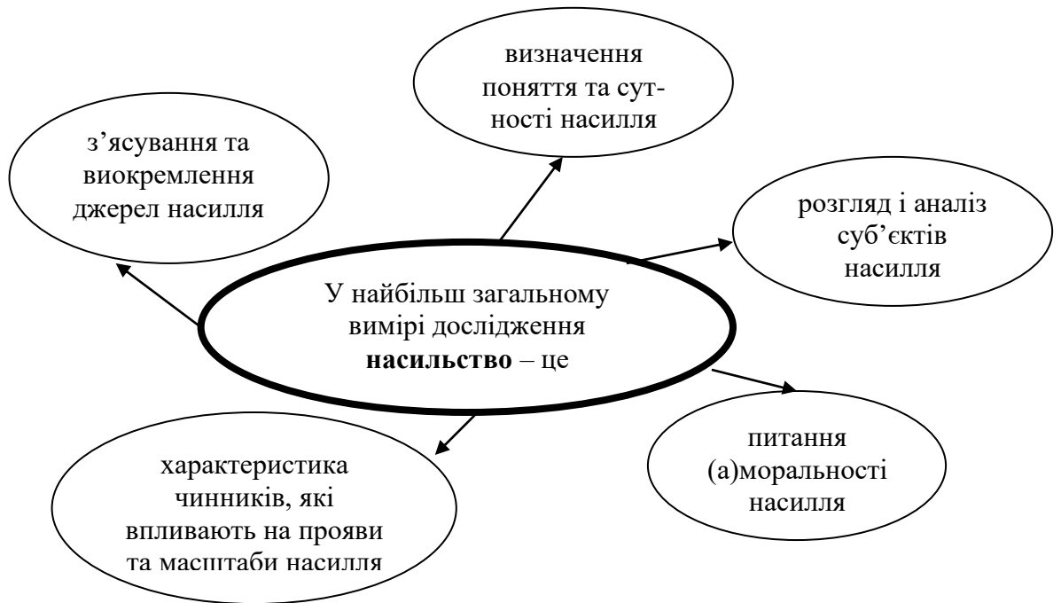
Рис.1.1. Насильство у загальному вимірі дослідження

крізь призму, зокрема, феноменологічного підходу. Для конструктивного розв'язання будь-якої проблеми – технічної, соціальної, політичної тощо й відповідно, досліджуваного явища – необхідно виявити причини, фактори, чинники, обставини, умови та передумови цього явища. Що таке насильство взагалі? На рис.1.1. нами представлено схематичну відповідь на дане питання (рис1.1.).