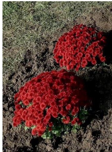
Рисунок 5. Хризантема червона.