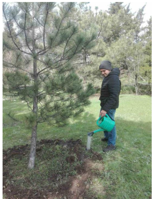
Рисунок 2. Полив.