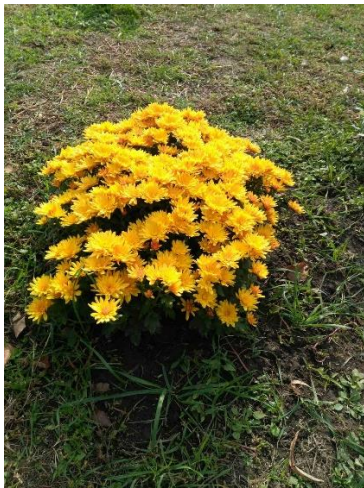
Рисунок 4. Хризантема жовта.