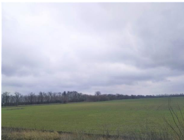
Рисунок 3. Фотографія пейзажу.