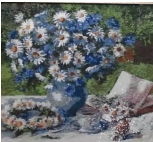
Рисунок 2. Натюрморт квітів.