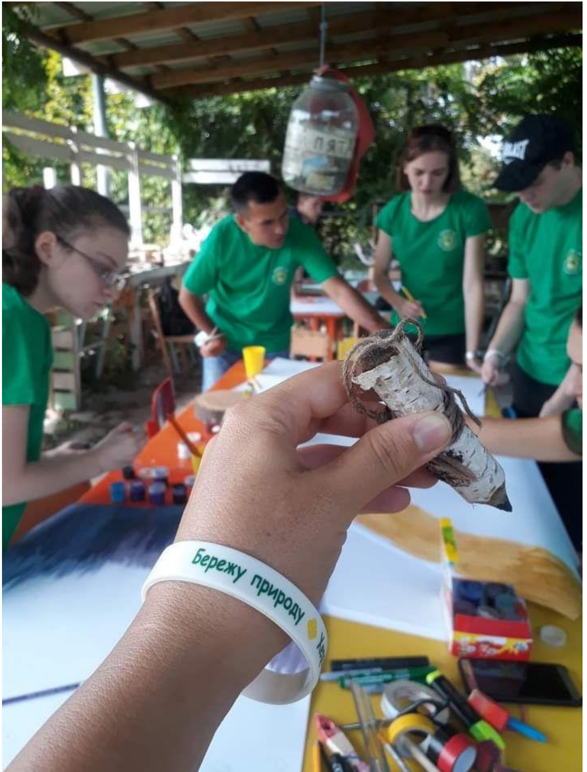
Рисунок 1. Підготовка плакатів до екологічного маршу.