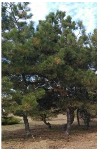
Рисунок 2. Сосна кримська.