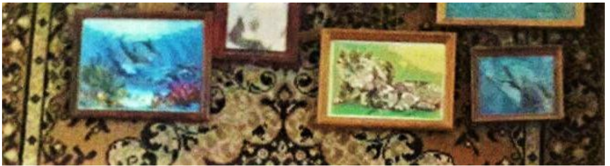
Рисунок 1. Картини природи.

1. Картини, виконані різними техніками: вишивання хрестиком, вишивання бісером, малювання