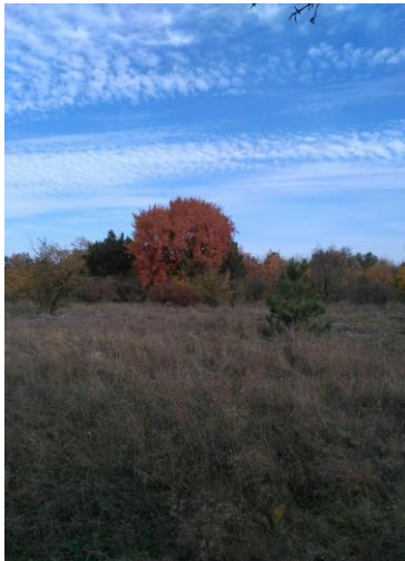
Рисунок 1. Степова зона ботсаду.

Фото з екскурсії для людей з особливими потребами «Хризантеми осіннього саду»