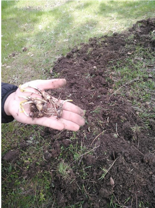
Рисунок 1. Висаджування нарцисів.