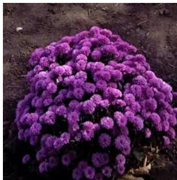
Рисунок 6. Хризантема фіолетова.