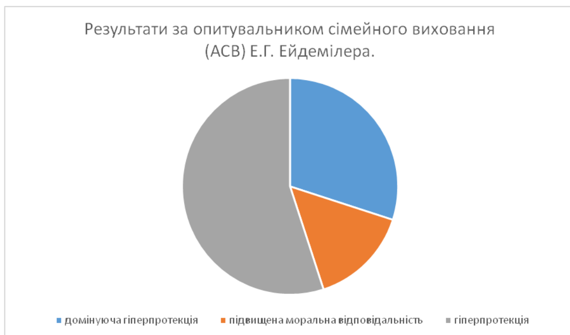
Рис. 2.1. Результати за опитувальником сімейного виховання (АСВ) Е.Г. Ейдемилера.

У жодного з батьків 0% (0 чоловік) не було виявлено таких типів сімейного виховання, як емоційне відкидання, жорстоке поводження, гіпопротекція (рис. 2.1.).