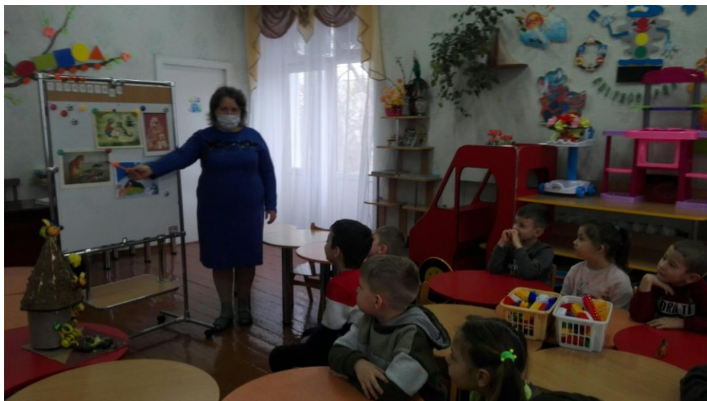
Фото 2.1. Фрагмент заняття «Тварини дикі та домашні» в середній групі закладу

Наводимо приклад заняття який ми провели за цією методикою з теми «Тварини дикі та домашні» в середній групі закладу. Ілюстрацію картини М.Приймаченко «Український кіт у чоботях» за якою відбувався опис наводимо у додатку В. На фото2.1. фрагмент заняття :