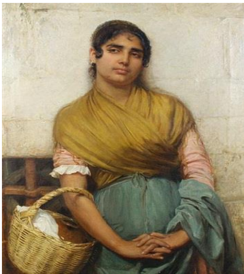
4. 2. 2. «Циганка з Сивіл' ї» Б. Берджес