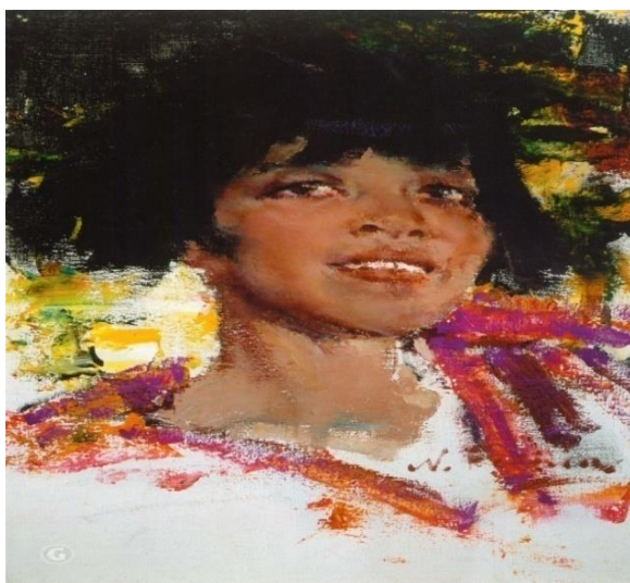
3. 2. 2. «Індійська дівчинка» М. Фешин