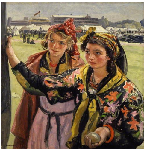
5. 2. 2. «Романи Белесс» Л. Найт