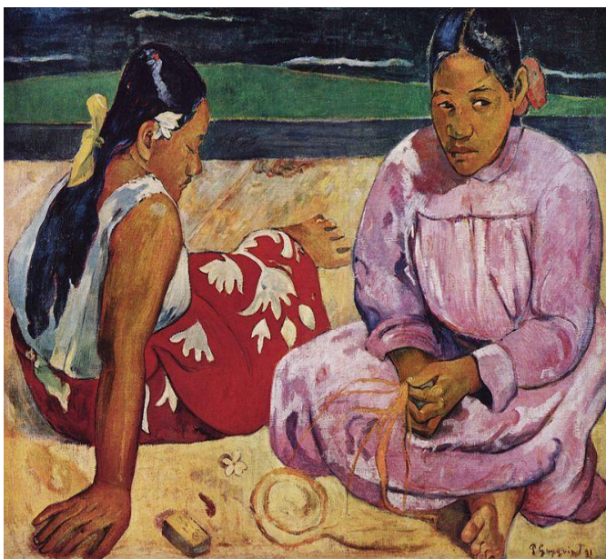
7. 2. 2 «Таїтянські жінки на узбережжі» П. Гоген