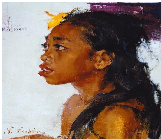
2. 2.2. « Дівчина з острову Балі» М. Фешин