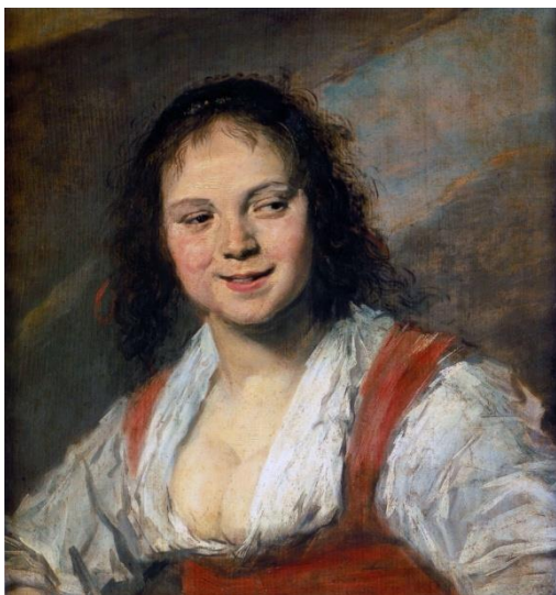
1. 2.2. «Циганка» Ф. Хальс