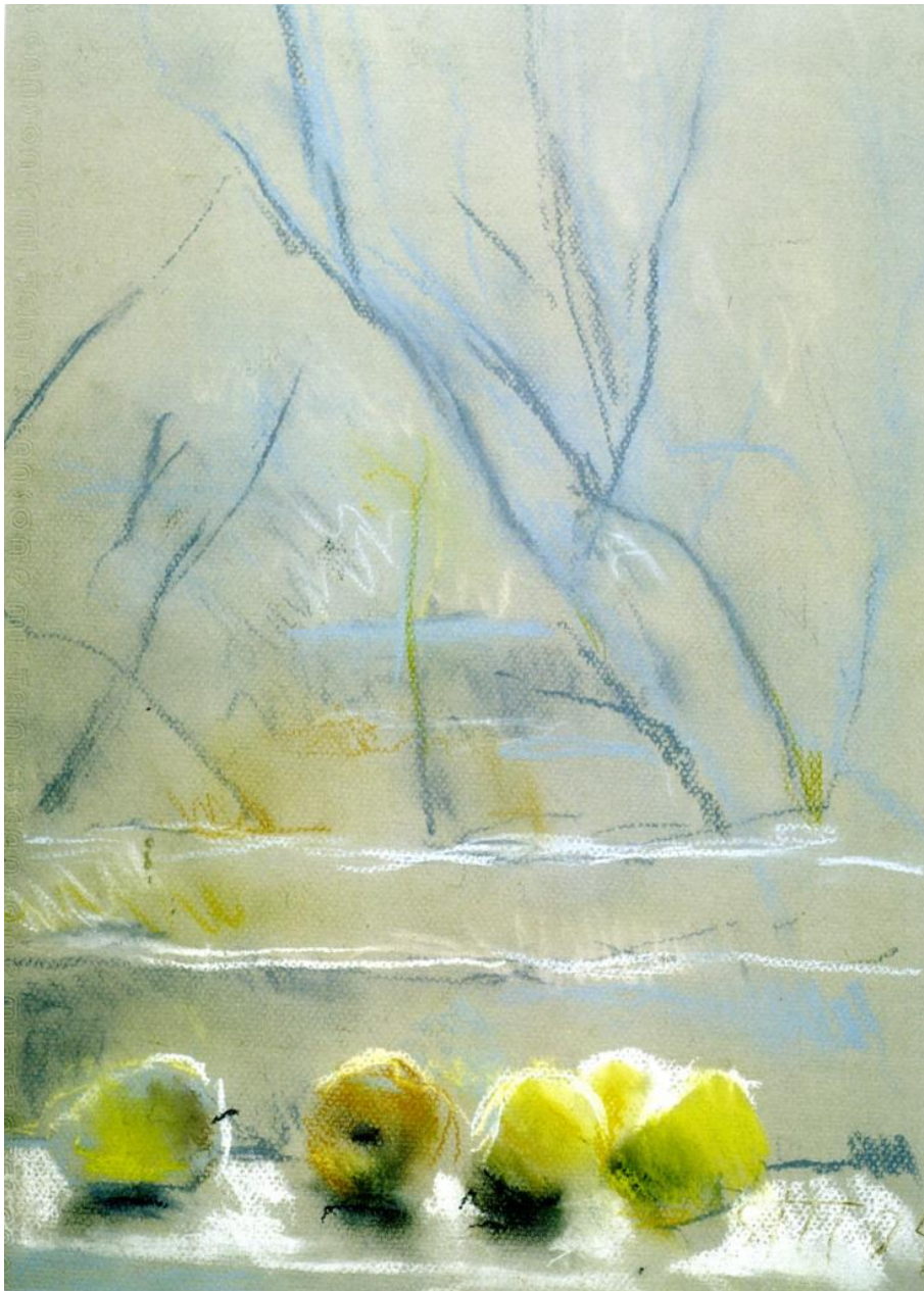
Рис. 1.3. Т. Н. Яблонська. «Яблучка».

Таким чином, у порівнянні з іншими жанрами в натюрморті набувають значимість невеликі предмети, які становлять композицію. Це можуть бути речі вирвані з контексту побуту. Предметний простір натюрморту завжди служить розкриттю об'єктивної своєрідності речей, їх неповторних якостей і краси. Натюрморт – це завжди світ олюднений, який скромними засобами висловлює почуття і думки, а головне: ставлення людей певного соціуму до свого життя.