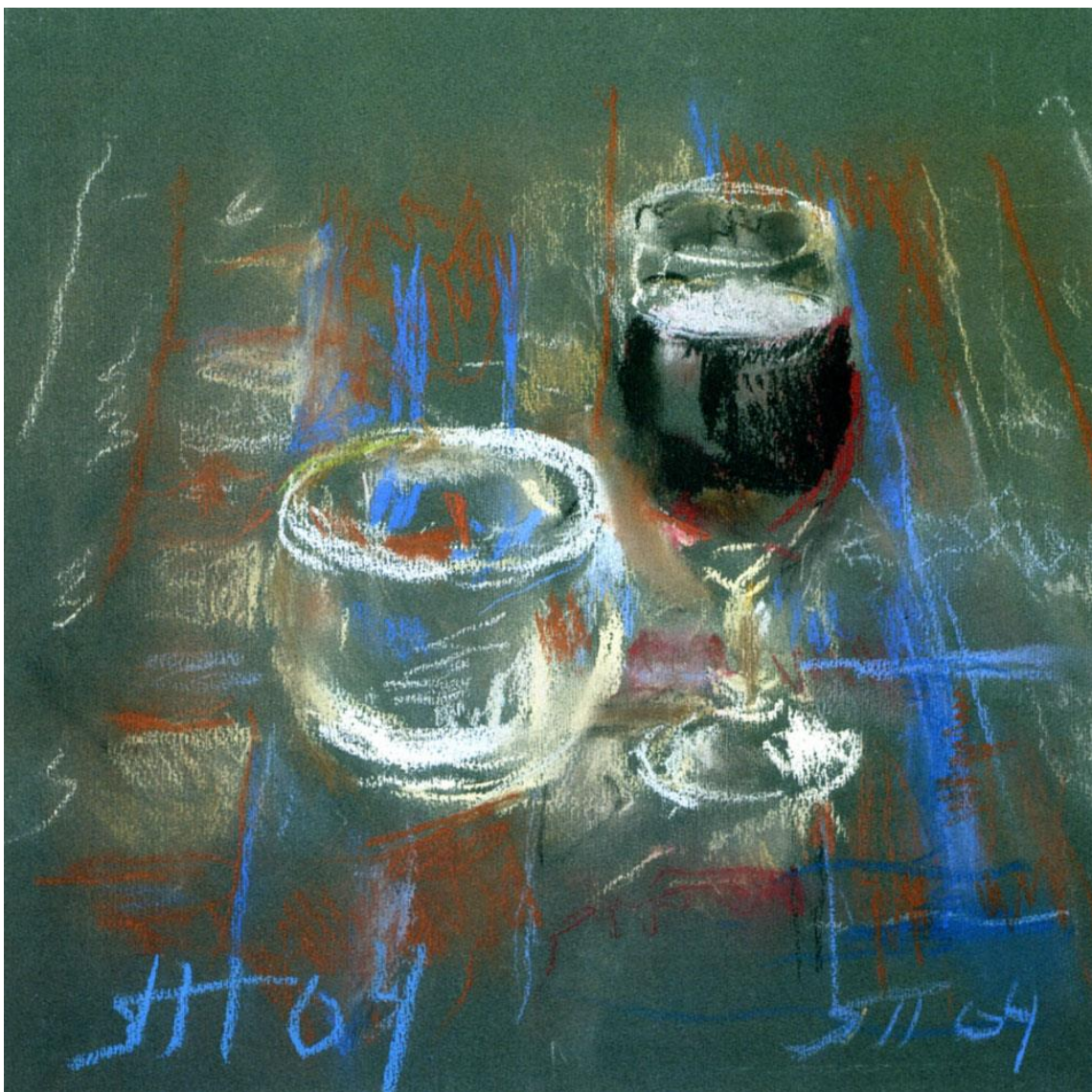
Рис. 1.2. Т. Н. Яблонська. «Сутінки».

У цих витончених і лаконічних за засобами виразності творах видно, як Тетяна Нилівна без тривалого і ретельного виписування деталей, досягає образної виразності буквально кількома точними штрихами і плямами. Це свідчення величезного досвіду, художньої майстерності, а головне величезної сили духу та любові до життя великої вітчизняної художниці [11].