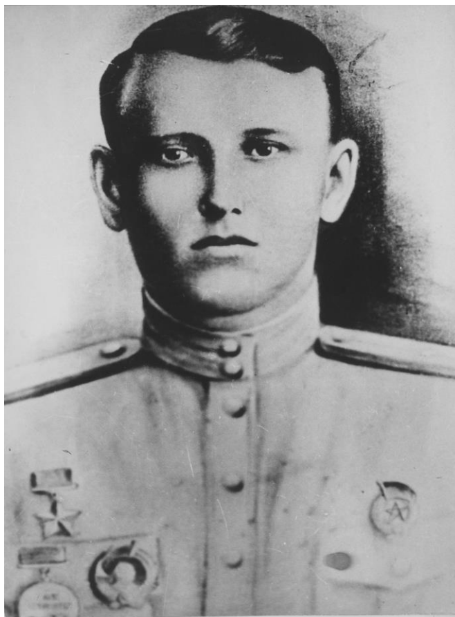
Герой Радянського Союзу Москаленко М.І.