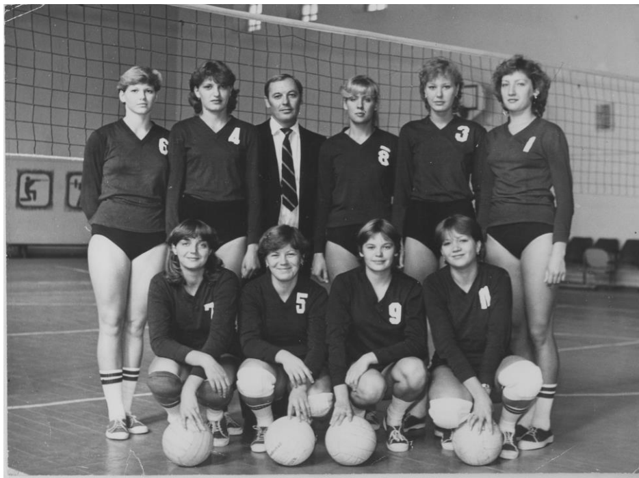
Жіноча команда інституту з волейболу (1983 р.)