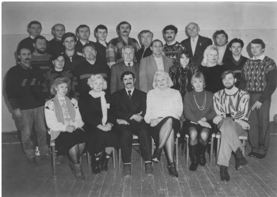
Склад кафедри фізичного виховання (1992 р.)