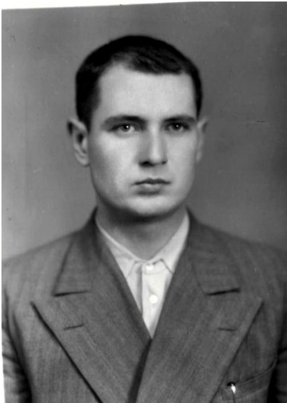
Студент Чернівецького державного університету ім. Юрія Федьковича (1952 р.)