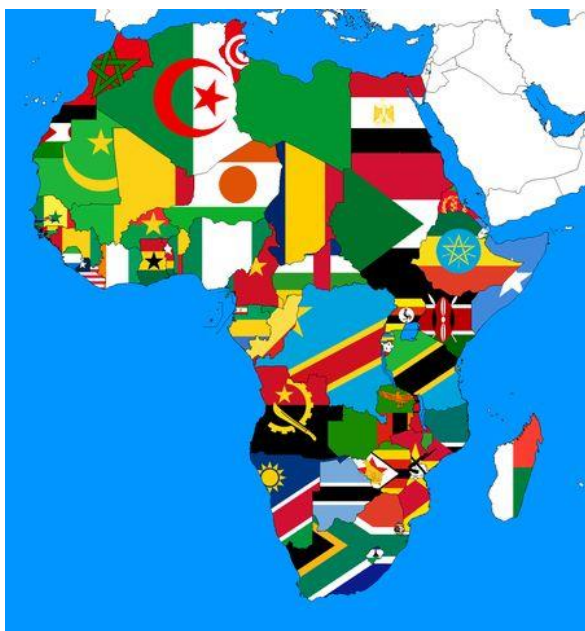
Рис. 5. Карта незалежних африканських держав після процесу деколонізації у ХХ ст.

Зокрема, 60-ті рр. ХХ ст. ознаменувалися розпадом колоніальних імперій в Африці, які існували до даного моменту. Серед них Англія мала 18 колоній, Франція – 16 колоній, Португалія – 4 колонії та Бельгія – 1 колонію. На карті Африці з'явилися нові, визнані міжнародною спільнотою незалежні держави (рис. 5).