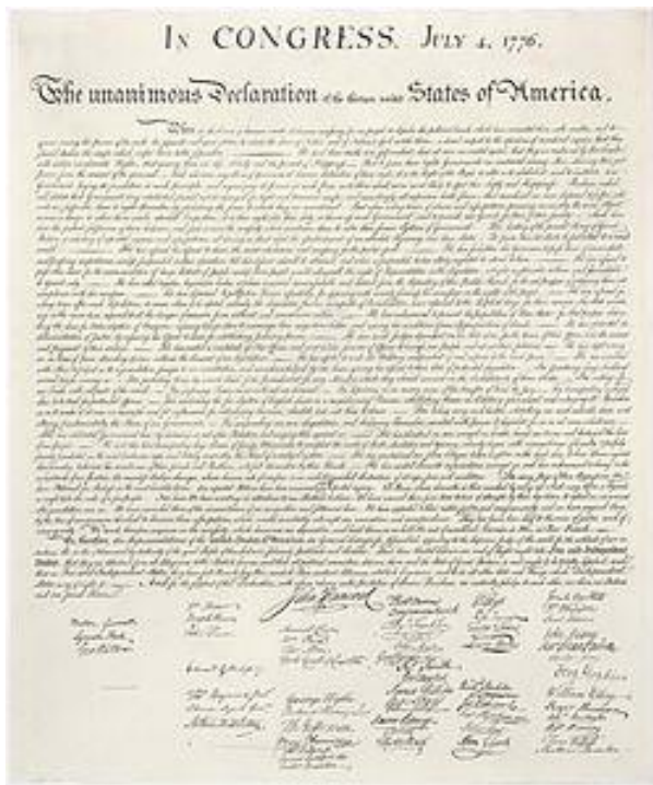
Рис. 2. Декларація незалежності США 1776 р.

Наступним етапом визнання незалежності США стало підписання Паризького договору (1783 р.) між Великобританією та США, який ще має назву «Паризький або Версальський мир» [42].