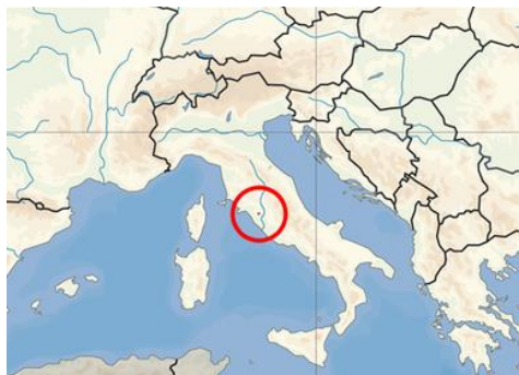
Рис.4. Карта території Мальтійського ордену.

Цікавим фактом є те, що дані суб'єкти міжнародних відносин мають невелику територіальну площу: Ватикан – 44 га, Мальтійський орден – 0,012 км 2 (рис. 4).