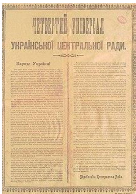
Рис. 3. Четвертий Універсал Української Центральної ради Української Народної Республіки.

Зокрема, Четвертий Універсал проголошував незалежність та суверенність Української Народної Республіки (рис.3).