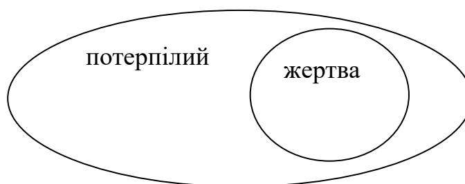
Рис.1. Співвідношення понять «потерпілий» та «жертва»

Як бачимо, поняття потерпілий є більш ширшим та включає в себе поняття жертва. Схематично дане співвідношення відображено нами на рис. 1.