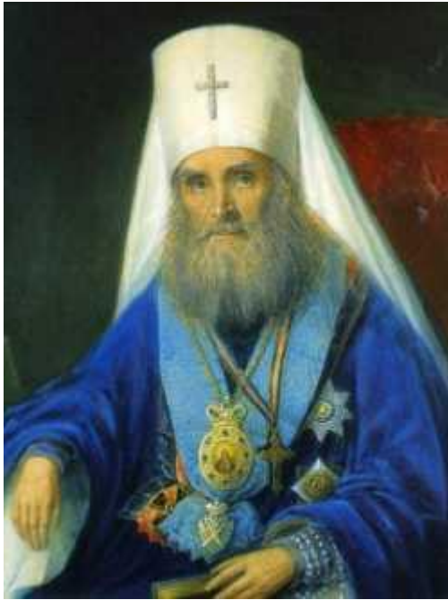
Митрополит Московський Філарет (Дроздов)