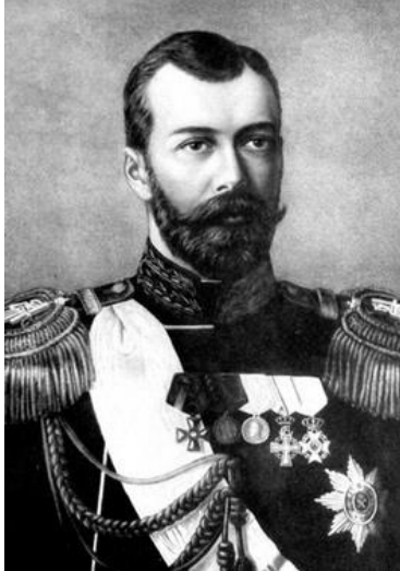
Цар Микола II