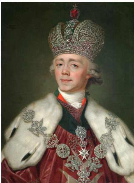
Цар Павло I