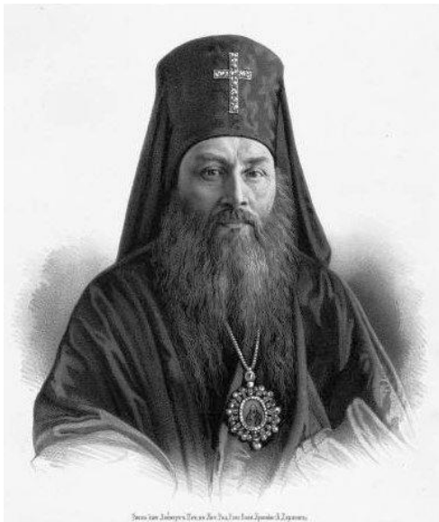
Архієпископ Інокентій Херсонський (Борисов)