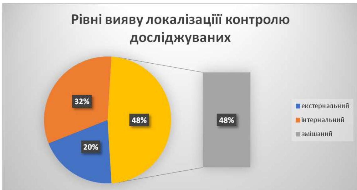
Рис. 2.4 Локалізація локусу контролю (когнітивної орієнтації) досліджуваних

Результати застосованого тесту дозволили встановити у групі досліджуваних підлітків: екстернальна орієнтація локалізації контролю у 5 (20%) підлітків, інтернальна орієнтація 12 (48%), змішаний тип 8 (32%). З огляду на розподіл результату можемо зауважити, що все ж таки внутрішня відповідальність, притаманна більшості досліджуваних, але і характерними є вияв змішаної форми когнітивної орієнтації, що відповідає віковій нормі досліджуваних (див. рис. 2.4).