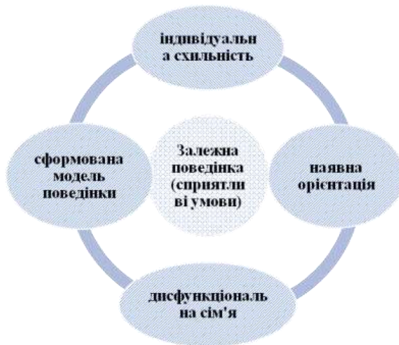
Рис. 2.1. Цикл-процес соціально-психологічних підвалин формування залежної поведінки

наповненості та комфорту. Незважаючи на відмінності у демонстрації (зовнішні відмінності) залежні форми поведінкових актів і вчинків мають схожі психологічні механізми. Це дозволяє стверджувати, що ознаки і механізми її формування мають схожі підвалини. Вченими у напряму виділені основні узагальненні ознаки демонстрації залежної поведінки: по-перше – стійке постійне прагнення до зміни психофізичного стану; по-друге – як наслідок втрата самоконтролю. Залежна поведінка не виникає раптово, для її демонстрації потрібні сприятливі умови для формування і укорінення – це процес, який має початок, індивідуальне протікання, виявлення і результат як сформована модель поведінки (див. рис. 2.1). Здатність протистояти, а не піддаватися укоріненню відхиляючих форм поведінки залежить від рівня розвитку когнітивних процесів, інтелектуальної включеності, сили/слабкості нервової системи.