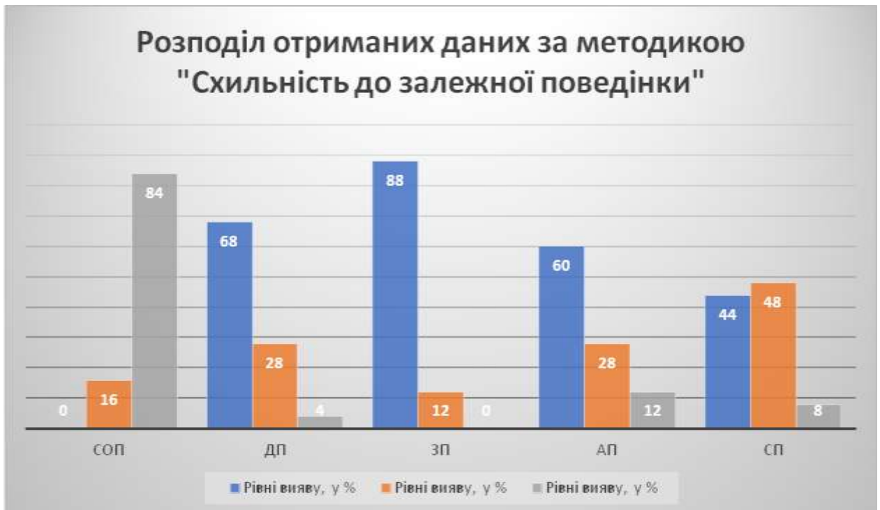
Рис 2.3. Розподіл отриманих результатів діагностики досліджуваних за методикою СДП, у %

Психологами встановлено, що когнітивна орієнтація особистості «локус контролю» впливає на характерологічні прояви на емоційному та поведінковому рівнях. Наступним кроком нашого дослідження буде аналізування отриманих даних за методикою Дж. Роттера «Локус контролю». Автором методики було визначено два полюси атрибутивної властивості «екстернальний» та «інтернальний» локус контролю. Екстерналам почасти притаманні такі характерні риси поведінки як: безвідповідальність, прагнення знову і знову відкладати здійснення своїх намірів, Прокрастинація, невпевненість у своїх здібностях, підозрілість, тривожність, депресивність, агресивність, конформізм, авторитарність, безпринципність, цинізм, схильність до обману неприйнятність критики на свою адресу. Інтернали навпаки, завжди вважають, що все, що з ними відбувається це насамперед залежить від його сприйняття ситуації та організації діяльності, почасти їм притаманні такі особистісні риси як: цілеспрямованість, пунктуальність, компетентність, внутрішня справедливість і спонукальна