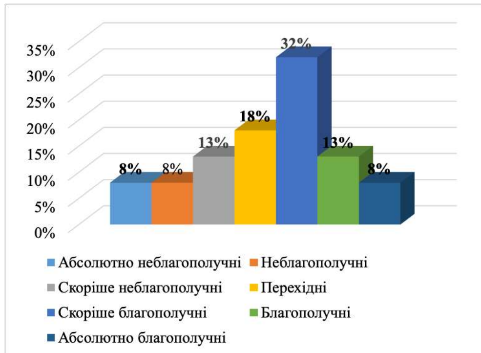
Рис. 2.3 – Результати розподілу задоволеності шлюбом

Кількісні результати за тестом-опитувальником задоволення шлюбом (В. Столін, Т. Романова, Г. Бутенко) представлено на рисунку 2.3.