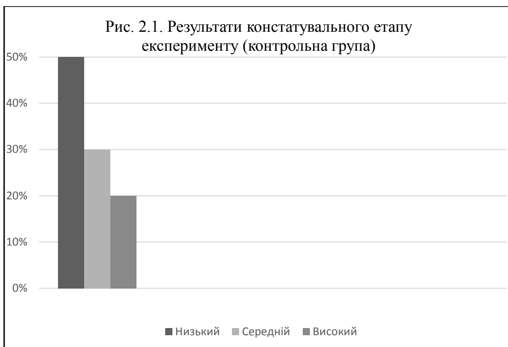
Рис. 2.1. Результати констатувального етапу експерименту (контрольна група)