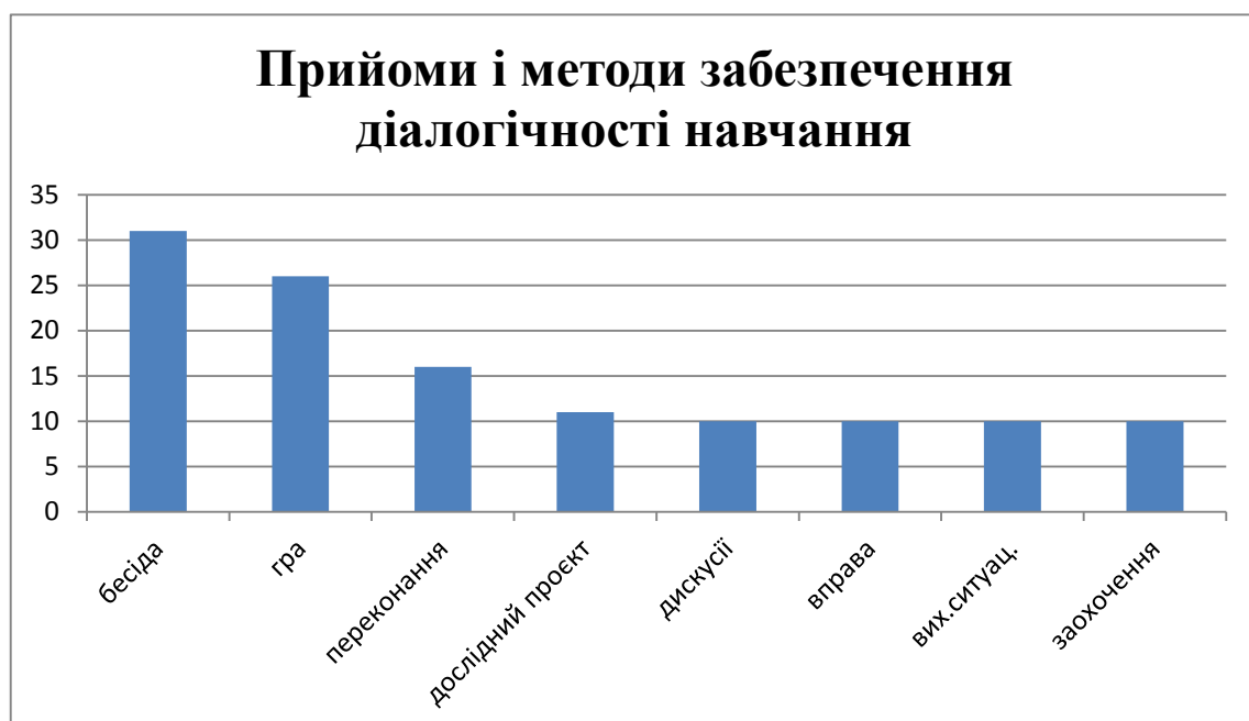
Діаграма 2.2.1. Прийоми і методи забезпечення діалогічності навчання

Четверте питання було направлене на виявлення уявлень педагогів про умови забезпечення діалогічності навчання в освітніх реаліях НУШ. Значна частина (63%) учасників опитування не змогли дати на нього відповідь. Решта (37%) педагогів виділили такі умови забезпечення діалогічності навчання, які представлені в порядку зменшення частоти називання: встановлення партнерських відносин між педагогами та учнями, заснованих на повазі, довірі (35%); створення можливостей відкритого діалогу, обміну цінностями між педагогами та учнями (22%);