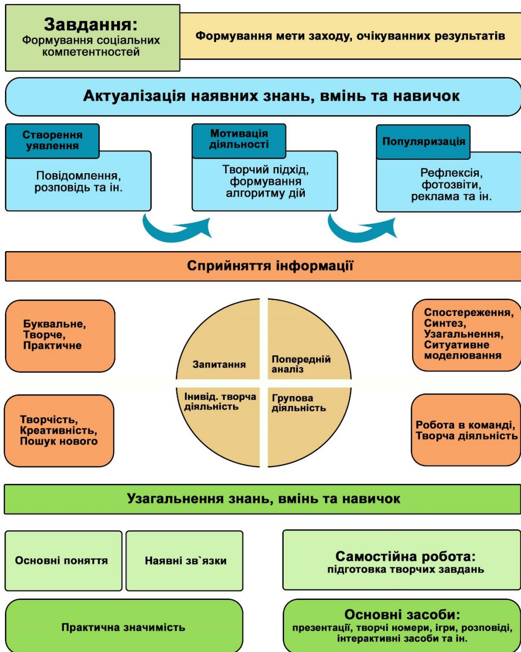
Рис. 3.3. Конструктор компетентнісно-орієнтованого спортивно-масового заходу

Отже, розробка сценарію та його подальше втілення – це певний творчий процес, для якого необхідна фантазія та організованість. Важливого значення при побудові структурних елементів сценарію спортивно-масового заходу є розташування його компонентів на основі хронологічної залежності. Крім загальної структури сценарію розробляються складові його вхідних компонентів: ігор, показових виступів, естафет, конкурсів та інше.