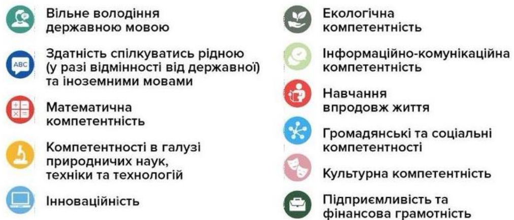
Рис. 1.2. Компетентності нової української школи.

Аналіз державного стандарту початкової та середньої освіти дозволив визначити основні компетентності нової української школи (рис. 1.2.).