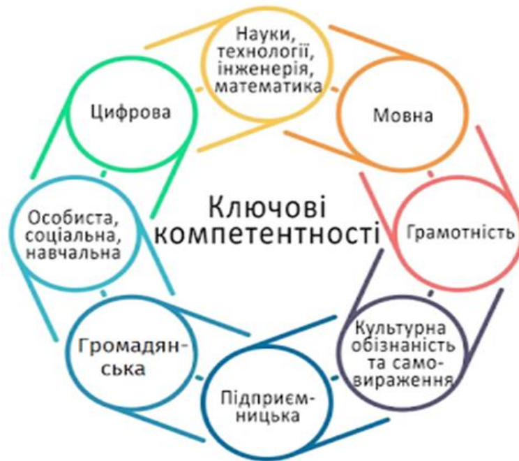
Рис. 1.1. Ключові компетентності особистості.

Аналіз державного стандарту початкової та середньої освіти дозволив визначити основні компетентності нової української школи (рис. 1.2.).