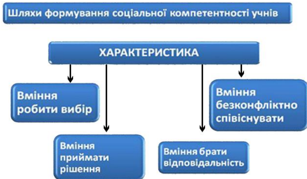
Рис. 3.2. Складові спортивно-масових заходів, що впливають на розвиток соціальних компетентностей школярів

З метою вирішення поставлених завдань кваліфікаційної роботи, ми проаналізували можливості використання спортивно-масових заходів у формуванні саме соціальних компетентностей учнів. Основні складові спортивно-масових заходів, що впливають на розвиток соціальних компетентностей представлені на рисунку 3.2.