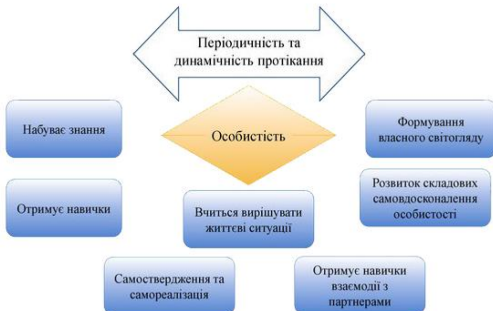
Рис. 3.1. Напрямки впливу спортивно-масової роботи на особистість дитини

Основною метою роботи осередку олімпійської освіти та організації спортивно-масової роботи в НВК є заохочення дітей до здорового способу життя, занять фізичною культурою та спортом, формування олімпійських цінностей, залучення до активних занять руховою активністю [5, 9, 19]. Напрямки впливу спортивно-масової роботи на особистість дитини представлені на рисунку 3.1.