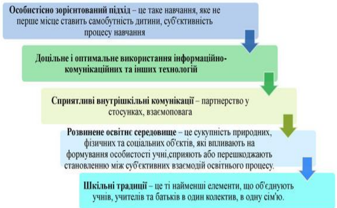
Рис. 1.4. Фактори педагогічного впливу на розвиток соціальної компетентності школярів

Враховуючи означені фактори, наведені на рисунку 1.4., ефективність формування соціальної компетентності залежить від активності використання діяльнісного підходу вчителя та учнів.