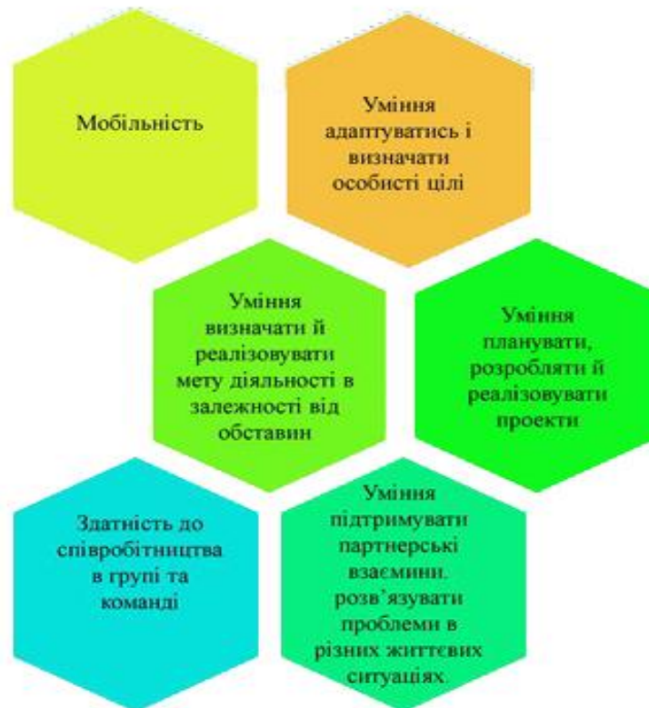
Рис. 1.3. Складові соціальної компетентності

Враховуючи все вище викладене, можна скласти наступну структурну схему соціальної компетентності (рис. 1.3.).