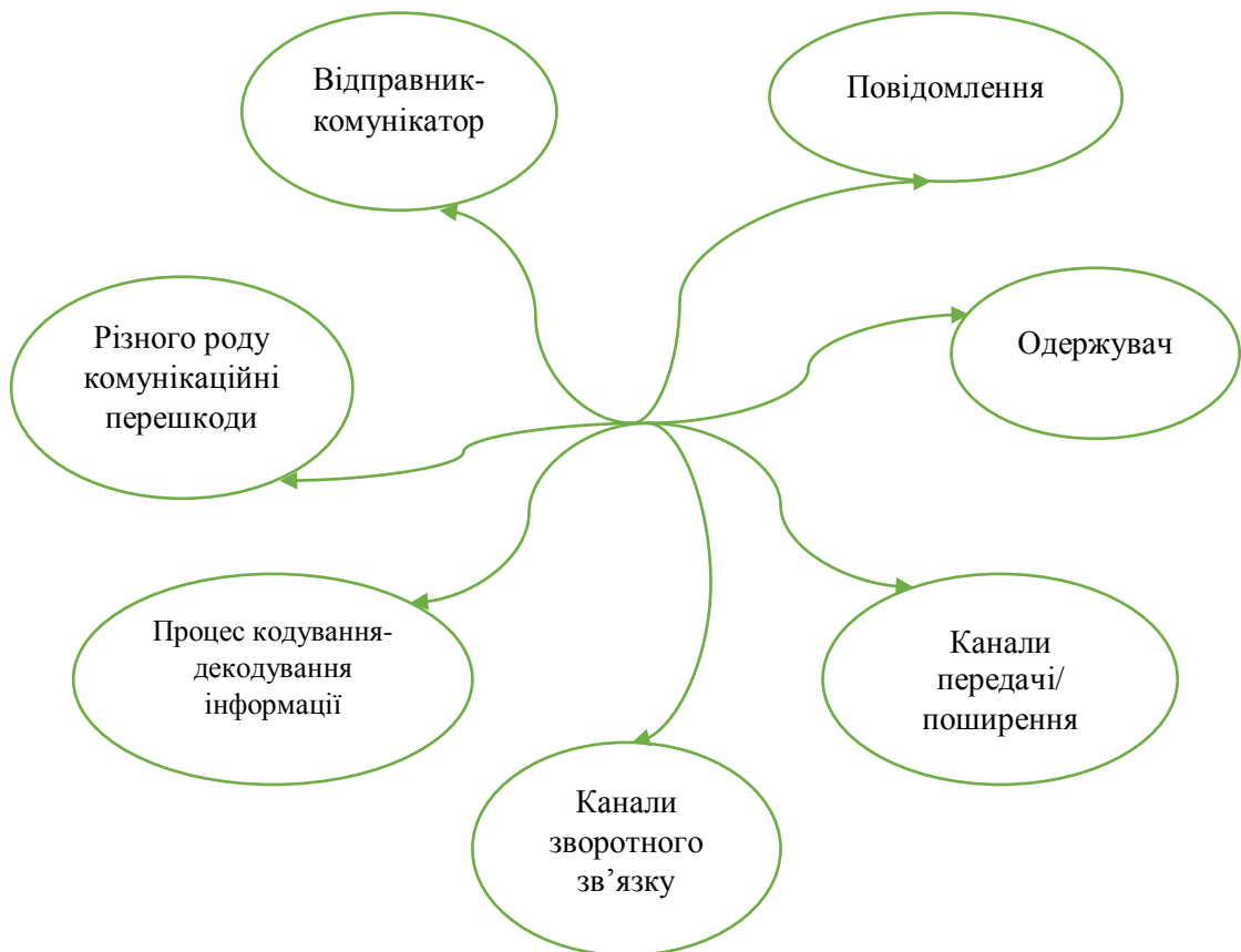
Малюнок 2.3. Складові комунікації органів публічної влади [20]

Будь-який процес публічної управлінської комунікації повинен містити типові складові, які відображені на малюнку 2.3.