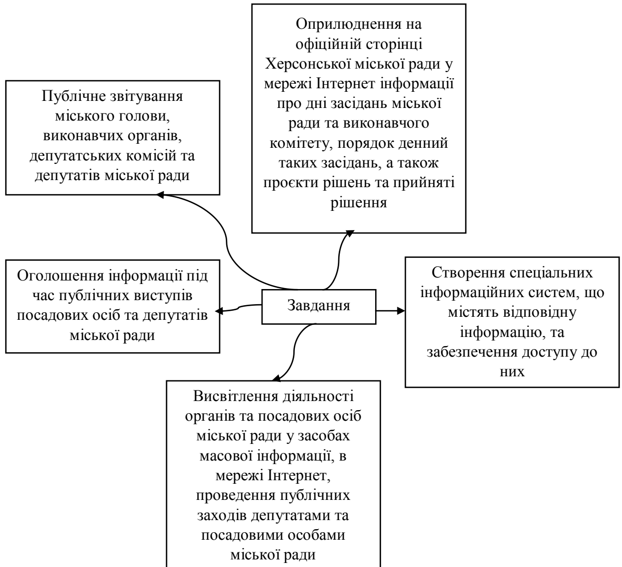
Малюнок 2.1. Головні завдання департаменту у інформаційних технологій [12]

Основні завдання департаменту інформаційних технологій перелічені на малюнку 2.1.