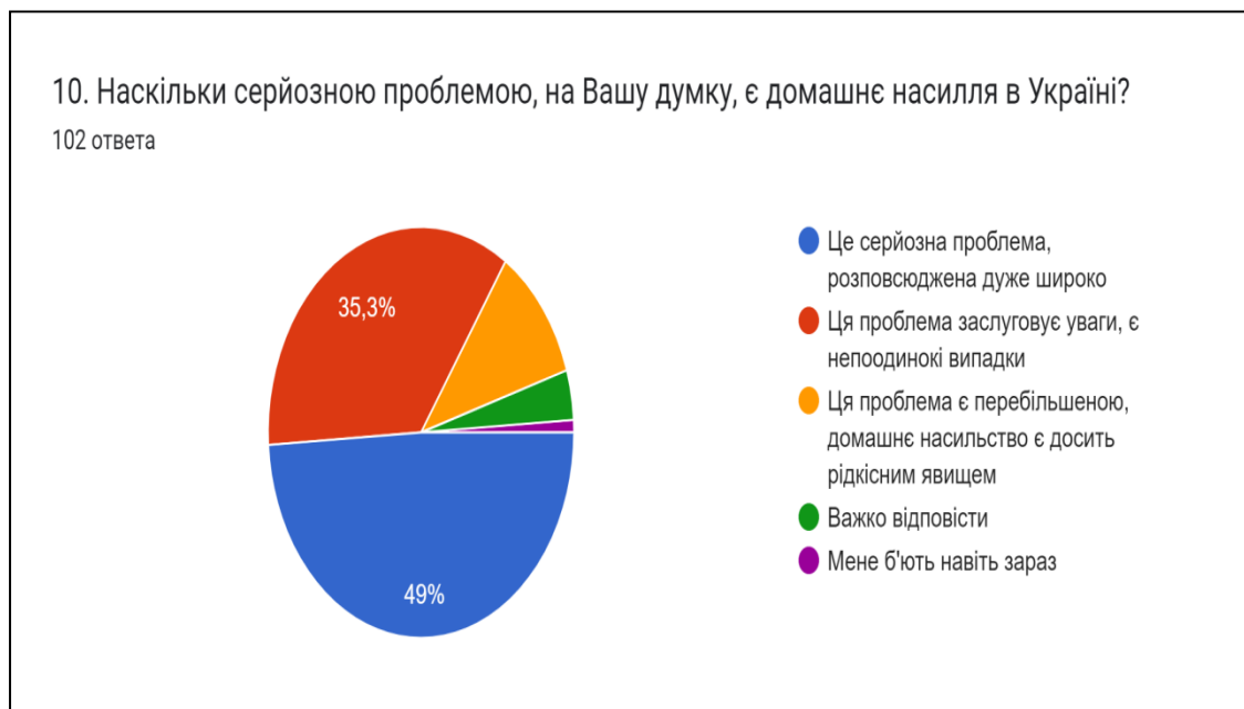
Діаграма 3.1.3. (власна розробка)

Отже, домашнє насильство стало вагомою проблемою, яка широко розповсюджена й заслуговує уваги, як зазначили більшість наших кореспондентів у своїх анкетах (84,3%).