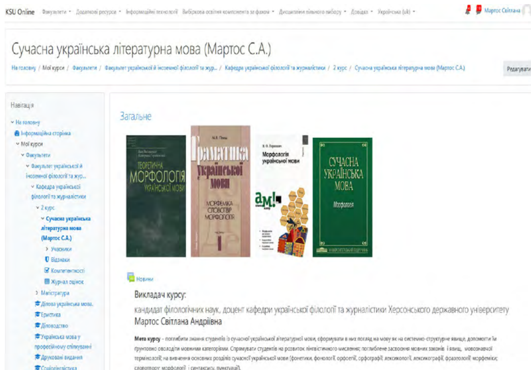
Рис. 1. Курс «Сучасна українська літературна мова» на KSU Online

і додаткової) із гіперпосиланнями; 6) перелік Інтернет-ресурсів, які можуть стати у нагоді здобувачам вищої освіти для опанування дисципліни; 7) нагадування студентам про те, що, виконуючи завдання, слід пам'ятати про підписаний ними «Кодекс академічної доброчесності здобувача вищої освіти».