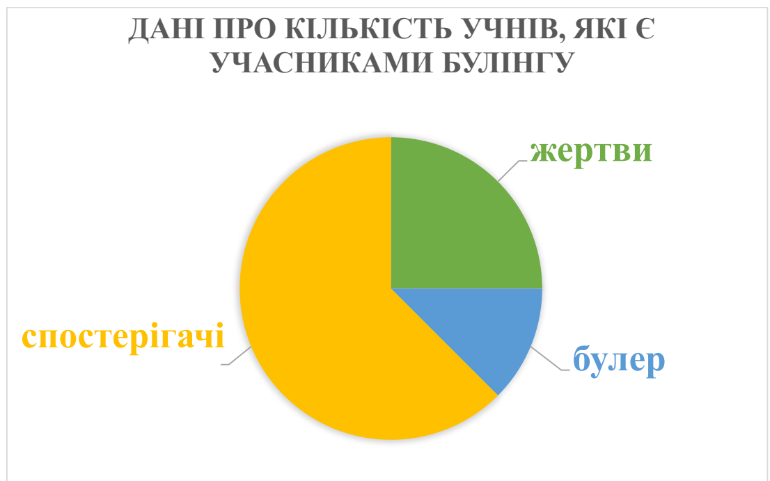
Рис.2.2. Дані про кількість учнів, які є учасниками булінгу

Також, ми склали схему, де у відсотковому відношенні показано, скільки в колективі жертв (25%), булерів (12,5%) та спостерігачів (62,5%).