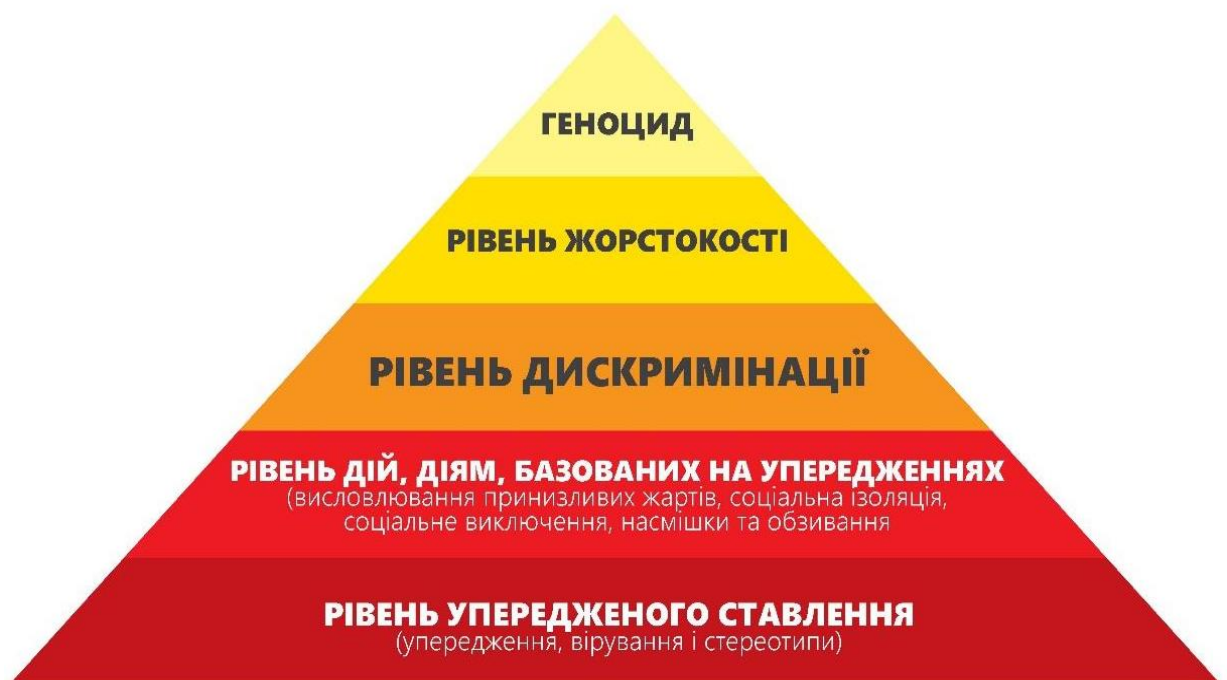
Рис.Б.1. Схема «Піраміди ненависті»

Згадаймо піраміду Маслоу. Підніжжя її – це наші фізіологічні, базові потреби: їжа, вода, сон, секс, дихання. Якщо ці потреби не задоволені, ми не можемо піднятися на вищий рівень: рівень безпеки.