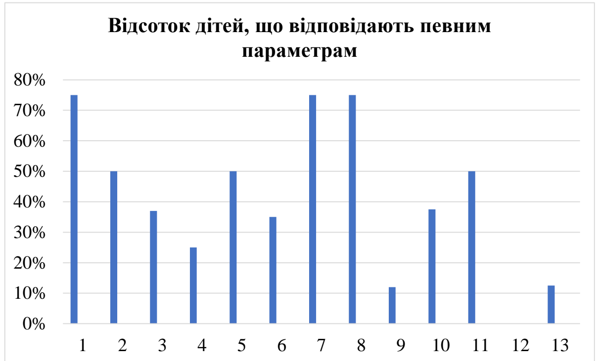
Рис.2.1. Дані про кількість учнів, що відповідають певним параметрам

Отримані дані таблиці 2.2 представлено на малюнку 2.1.