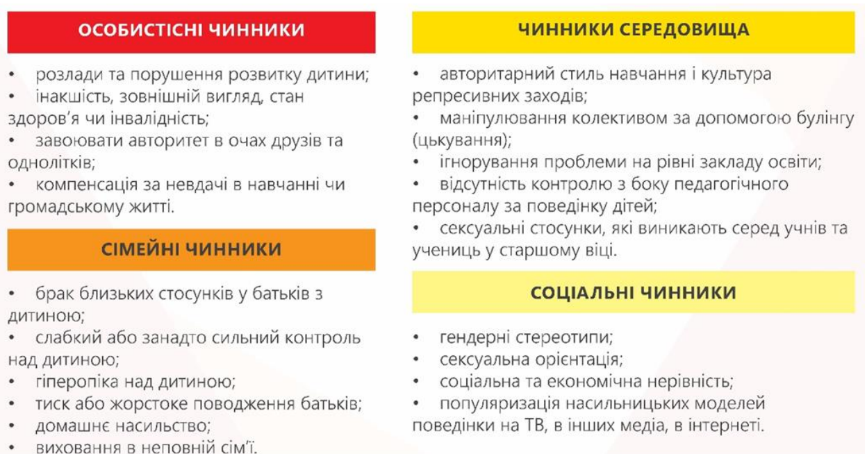
Рис. 1.1. Класифікація причин булінгу.

Насильство в навчальних закладах часто є поєднанням багатьох факторів.