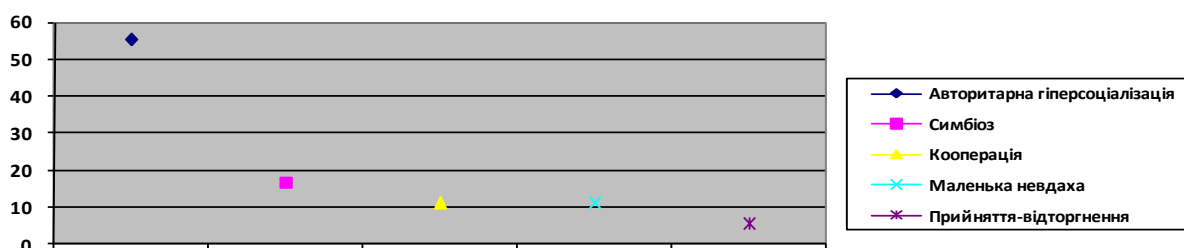
Рис. 1 Результати дослідження типу ставлення батьків до дітей (вибірка-підлітки з високим рівнем особистісної тривожності та їх батьки)

Порівняльний аналіз відповідей батьків і дітей показав такі результати: серед вибірки досліджуваних, яку склали підлітки з високим рівнем особистісної тривожності та їх батьки провідним виявився тип ставлення “Авторитарна гіперсоціалізація”. По даній шкалі 55,5% вибірки отримали найбільшу кількість балів. У 16,6% досліджуваних переважає тип ставлення “Симбіоз”, у 11,1% - “Кооперація” і у такої ж кількості процентів досліджуваних тип ставлення “Маленька невдаха”. За шкалою “Прийняття-відторгнення” лише 5,5%) отримали найбільшу кількість балів (рис. 1).