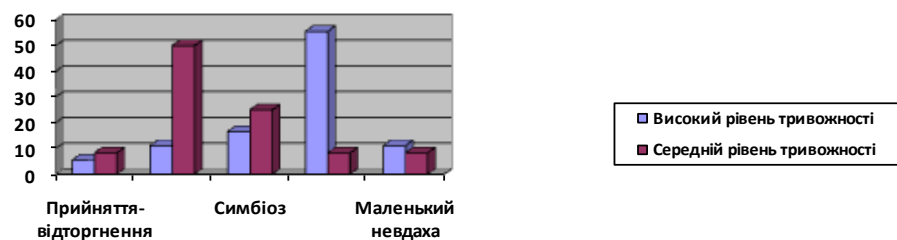
Рис. 2. Результати дослідження типу ставлення батьків до дітей (вибірка – підлітки з високим рівнем особистісної тривожності)

Порівняльний аналіз результатів дослідження типу ставлення батьків до дітей серед підлітків із високим рівнем особистісної тривожності та їх батьків і підлітків із середнім рівнем особистісної та їх батьків можна представити у вигляді діаграми (рис. 2).