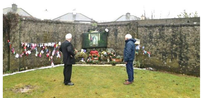
Меморіал на місці масового поховання дітей у притулку м. Туам

За результатами досліджень історикині Кетрін Корлесс записів про неофіційне поховання 796 дітей з будинку матері і дитини без зазначення обставин їхньої смерті було виявлено масове поховання віком від 2 днів до 9 років у резервуарі для стічної води на території притулку у м. Туам, який утримувало католицьке чернече об'єднання Bon Secours [5]. Такий факт спричинив офіційне розслідування діяльності притулків урядом Ірландії у 2015 р.