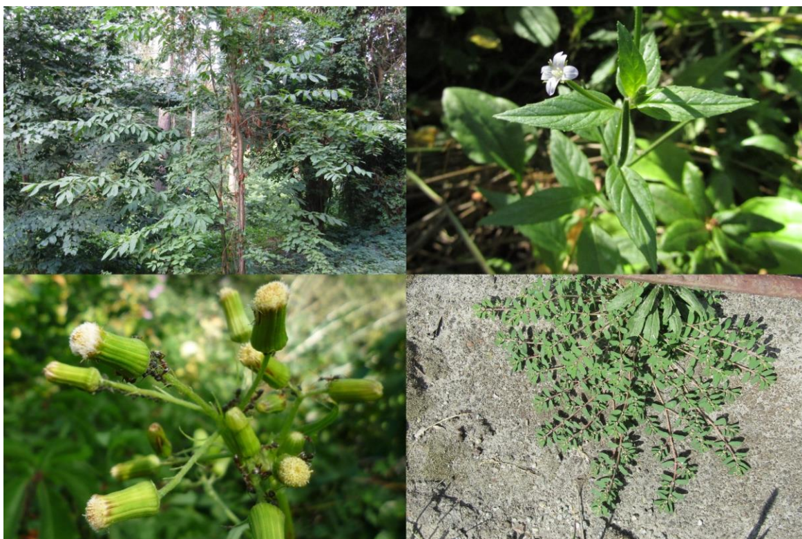
Рис 2. Верхній лівий кут – Самосівна особина Castanea sativa в НБС імені М.М. Гришка; верхній правий кут – Epilobium ciliatum ; нижній лівий кут – Erechites hieracifolia ; нижній правий кут – Euphorbia maculata в околицях НБС імені М.М. Гришка.

EUPHORBIA maculata L.: ксенофіт. – В межах НБС ще не відомий, але виявлені колонії на прилеглих територіях міста: газон і квітник по вул. Звіринецька, рясно, 50.4080, 30.5544, 16.10.2020!!; обочина Залізничного шосе, рясно, 1.07.2021!! ( www.inaturalist.org/observations/101758178 ) (Рис. 2).