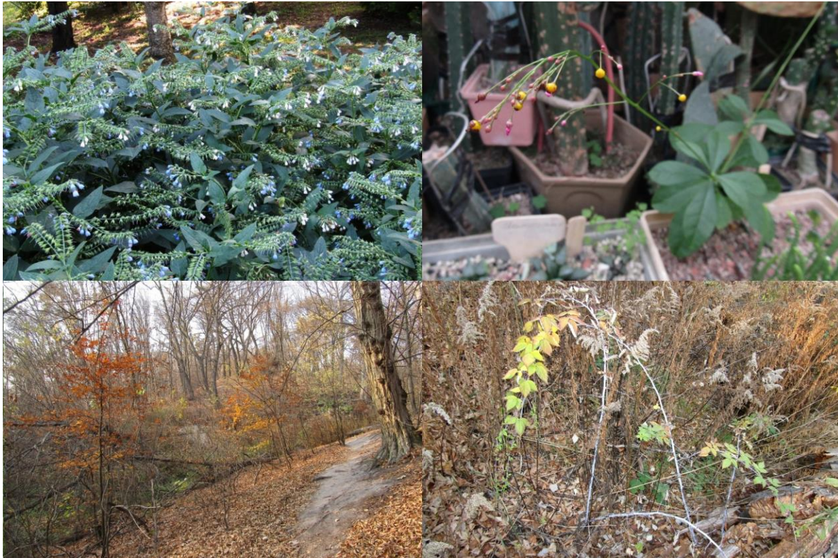
Рис. 6. Верхній лівий кут – Symphytum peregrinum у Сирецькому дендропарку; верхній правий кут – Talinum paniculatum у оранжереї Сирецького дендропарку; нижній лівий кут – спонтанний підріст Fagus sylvatica біля Сирецького дендропарку; нижній правий кут – Rubus occidentalis .

RUBUS occidentalis L. – На лівобічному схилі долини, невелика куртина; імовірно, занесено із рослинними рештками ( www.inaturalist.org/observations/101719730 ) (Рис. 6). TAXUS baccata L. – На лівобічному схилі долини, 1 сіянець, за 160 м від огорожі Сирецького дендропарку, звідки і занесено ( www.inaturalist.org/observations/101719713 ). VIBURNUM lantana L. – На лівобічному схилі долини, молода особина, за 110 м від огорожі Сирецького дендропарку ( www.inaturalist.org/observations/101719716 ). У Києві V. lantana природно зростала на схилах корінного берега Дніпра [SHYNDER, 2019a], а для віддалених від Дніпра лісів цей вид не наводився. VITIS riparia . – У долині, за 50 м від огорожі Сирецького дендропарку ( www.inaturalist.org/observations/101748246 ).