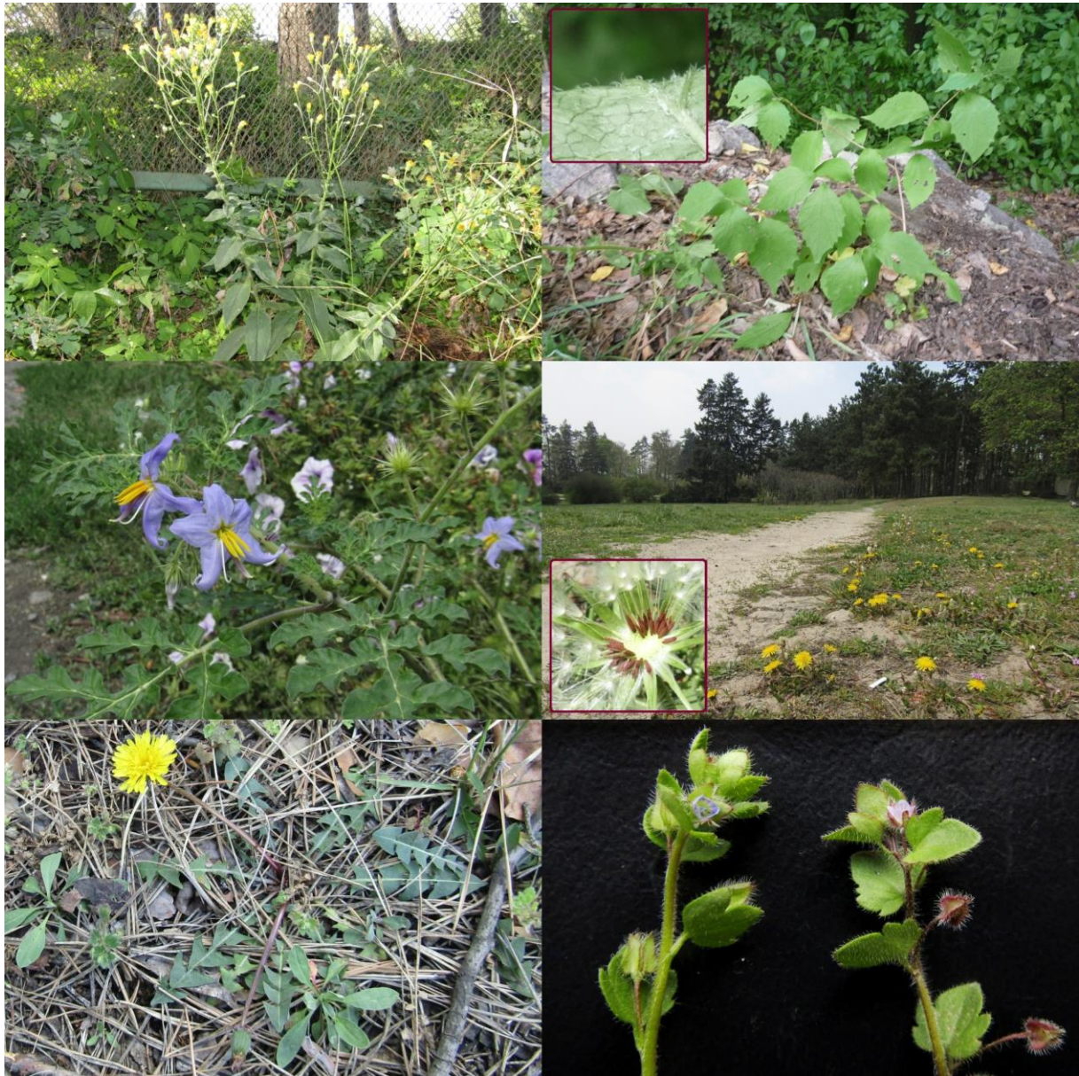
Рис. 3. Верхній лівий кут – Hieracium sabaudum subsp. virgultorum ; верхній правий кут – спонтанний підріст Philadelphus pubescens в НБС; центральний справа – Solanum heterodoxum ; центральний зліва – Taraxacum proximum ; нижній лівий кут – Taraxacum scanicum ; нижній правий кут – Veronica hederifolia (зліва) і V. sublobata (справа).

Fig. 3. Upper left corner – Hieracium sabaudum subsp. virgultorum ; upper right corner – Spontaneous growth Philadelphus pubescens in M.M. Gryshko NBG; central left – Solanum heterodoxum ; central right – Taraxacum proximum ; lower left corner – Taraxacum scanicum ; lower right corner – Veronica hederifolia (left) and V. sublobata (right).