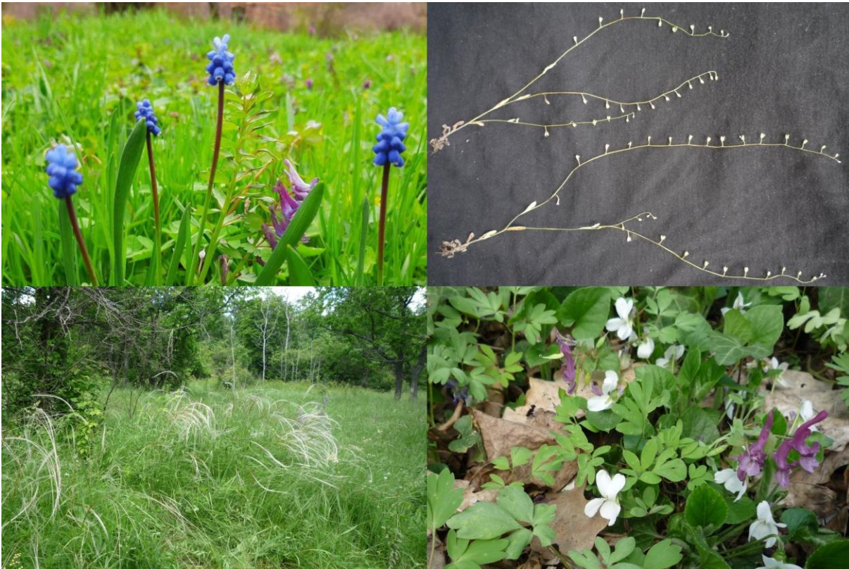
Рис. 5. Верхній лівий кут – Здичавлі рослини Muscari botryoides у дендропарку «Олександрія»; верхній правий кут – Myosotis ucrainica ; нижній лівий кут – Stipa pennata ; нижній правий кут – Натуралізований садовий гібрид Viola odorata complex.