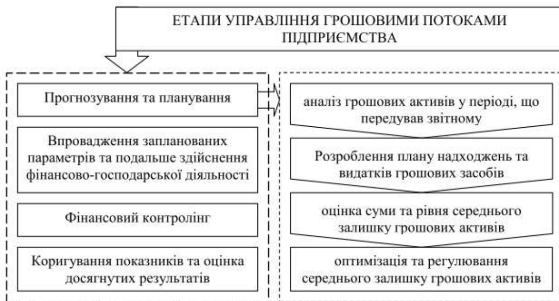
Рис. 1.1. Система управління грошовими потоками підприємства

На цій фазі поляжливо провести аналіз грошових коштів за період, що передує звітному періоду. Аналіз дасть змогу оцінити рівень, суму та середній залишок грошових коштів підприємства, а також провести ефективне використання грошових коштів з точки зору ліквідності підприємства та спроможності своєчасно розраховуватися за своїми зобов'язаннями. Основним завданням етапу планування та прогнозування, на нашу думку, є реалізація плану витрат і капітальних доходів підприємства в розрізі відповідних складових господарської діяльності підприємства, що сформує постійну платоспроможність підприємства.