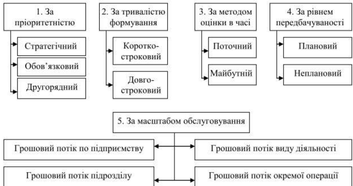
Рис. 1.3. Класифікація грошових потоків з метою стратегічного управління

При цьому, враховуючи потреби стратегічного управління та сучасні методи вирахування оборотів коштів, запропоновано визначати їх наступним методом (рис. 1.3).