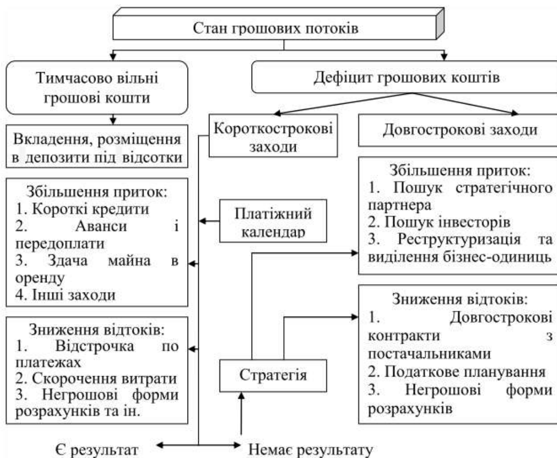
Рис. 3.1. Пропонована схема оптимізації та управління грошовими потоками

Короткострокові заходи можна використовувати у випадках, коли касовий розрив виникає протягом місяця. Звернутися до боржника вчасно або навіть раніше за встановлений договором термін для перерахування боргу. А поки варто спробувати домовитися з кредитором про відстрочку платежу.