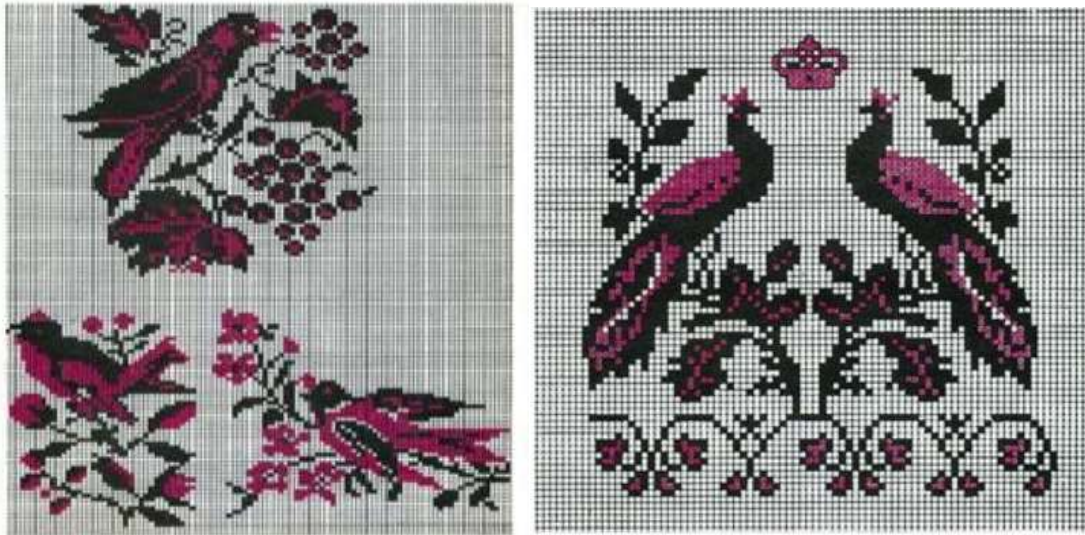
Рисунок 1.7 - Зооморфна вишивка

Виконані рослинним орнаментом вироби чоловічого і жіночого одягу відомі, за даними археологічних досліджень, ще з давньоруської доби, але перевага цим орнаментам почала надаватися в народних вишивках українського народу тільки з початку 19 століття.