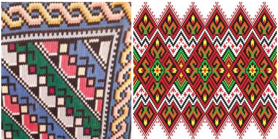
Рисунок 1.3 - Різнокольорова вишивка

Сірий – так само, як чорний і білий відноситься до ахроматичних кольорів, як і зелений, він утримує в собі протилежності але білого й чорного.