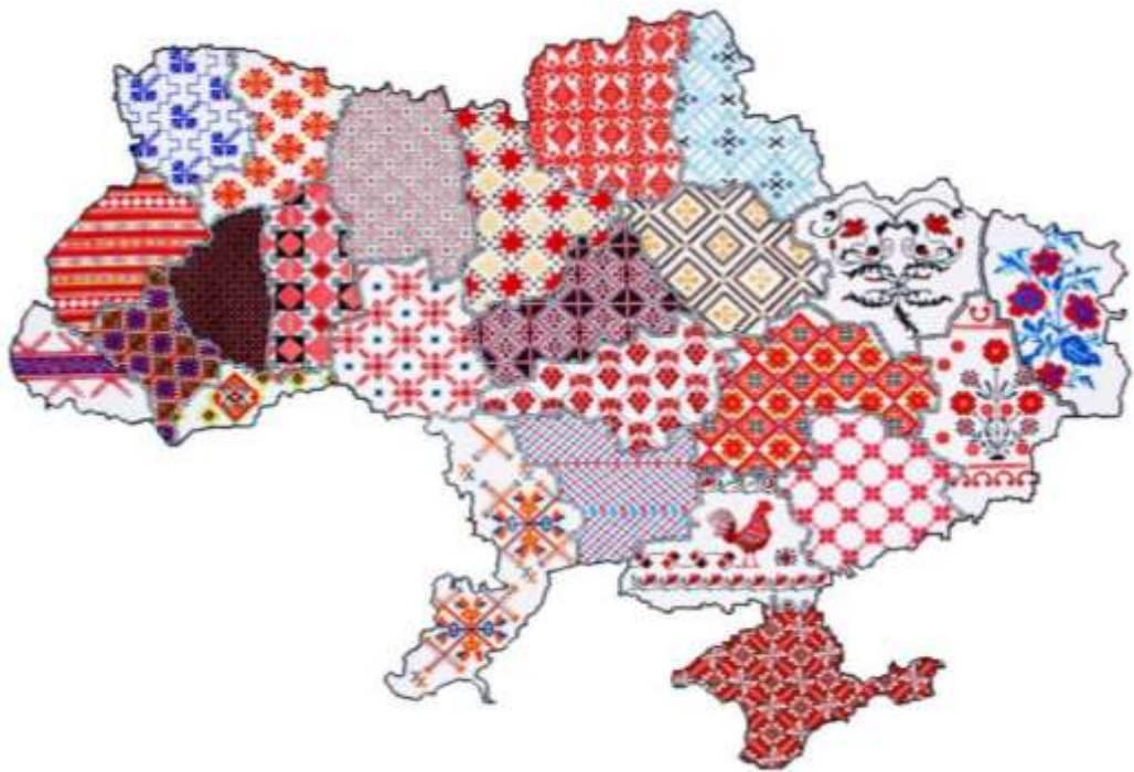
Рисунок А.1 - Україна моя вишивана: карта єдності