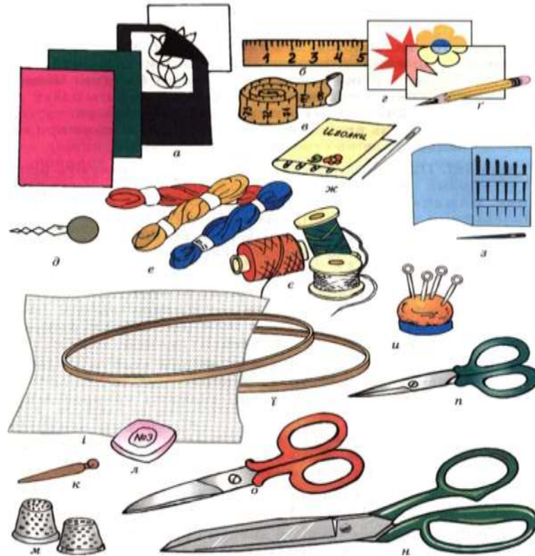
Рисунок А.2 – Матеріали для гри «Відгадай мене»