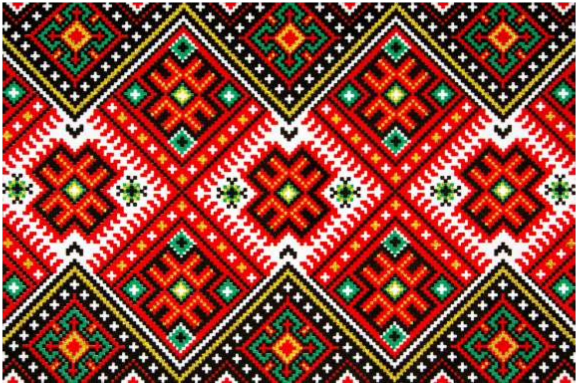
Рисунок 1.5 – Геометричний орнамент у вишивці

Найбільшою попитом користувалися геометричні орнаменти, які властиві для всієї прадавньої слов'янської міфології. Вони прості: кружечки, трикутники, ромбики, лінії, хрестики. З первинним віруванням у потойбічні сили наші пращури вишивали примітивні геометричні позначення: пряма горизонтальна лінія – символ землі; хвиляста лінія – символ води; хрест – символ вогню та сонця. Геометричні орнаменти були домінуючими для вишивок, особливо на одязі.