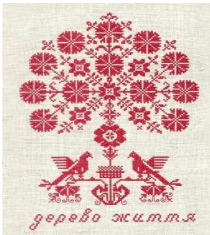
Рисунок 1.6 - Вишивка «Дерево життя»

Із спрощеного зображення рослинних мотивів складається рослинний (фітоморфний) орнамент. В основі рослинного орнаменту лежить прагнення перенести у вишивку красу природи. Навіть гранично умовні узори виникли внаслідок спостереження реально існуючих форм у природі. В українській вишивці часто використовуються такі мотиви, наприклад: як «барвінок» «виноград», «дубове листя», тощо. Деякі з цих мотивів несуть на собі відбиток стародавніх символічних уявлень українського народу. Візьмемо в якості прикладу, мотив «барвінку», який став символом немеркнучого життя, а узор «яблучне коло», поділений на чотири сектори, з вишиванням протилежних частин в одному кольорі став символом кохання. У сучасній вишивці може траплятися і стародавній символ такий як «дерево життя», який здебільшого зображується стилізовано у формі листя або гілок (рис. 1.6) [23].