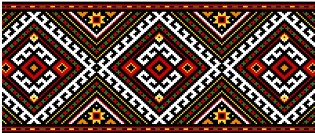
Рисунок 1.8 - Типовий орнамент в українській народній вишивці

Отже, виконавши аналіз літературних джерел, нами було виявлено, що найбільш типовими орнаментами в українській народній вишивці як у центральних та північних, так і в південних регіонах, були геометричні фігури (ромби, квадрати, хрести), а також рослинні і тваринні орнаменти (рис. 1.8). При чому, особливе місце серед рослинних орнаментів займало зображення «Дерево життя», а серед тваринних – зображення саме птахів. В загальному висновку, усі значення представлених орнаментів зводяться до уособлення чоловічого і жіночого початку, символу природи, родючості, достатку. Коріння орнаментів знаходиться у віруваннях та традиціях українського народу [11].