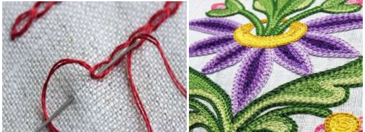
Рисунок 1.2 - Техніка «ланцюжок»

ця техніка з'явилася у ХІХ ст. і назва цієї техніки - «ланцюжок», «петелькою», «косичкою» (рис. 1.2) [21].