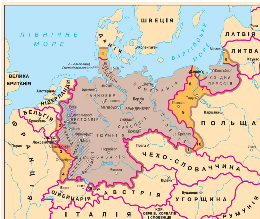
Орієнтовний вигляд таблиці