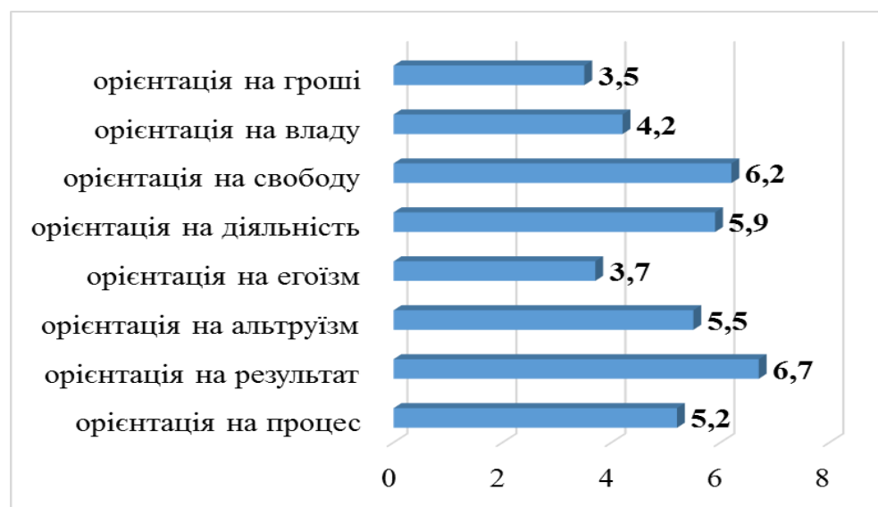
Рис. 2.3. Показники соціально-психологічних установок студентів

На рисунку 2.3 представлено результати за «Методикою діагностики соціально-психологічних установок особистості у мотиваційно-потребнісній сфері» О. Потьомкіної.