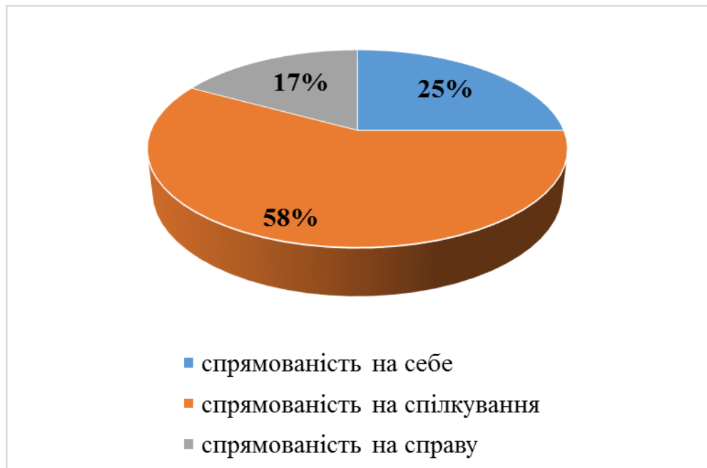
Рис. 2.1. Відсотковий розподіл результатів дослідження спрямованості студентів

проблем, виконанні роботи якнайкраще, орієнтовані на ділову співпрацю, здатні відстоювати свої інтереси в справі.