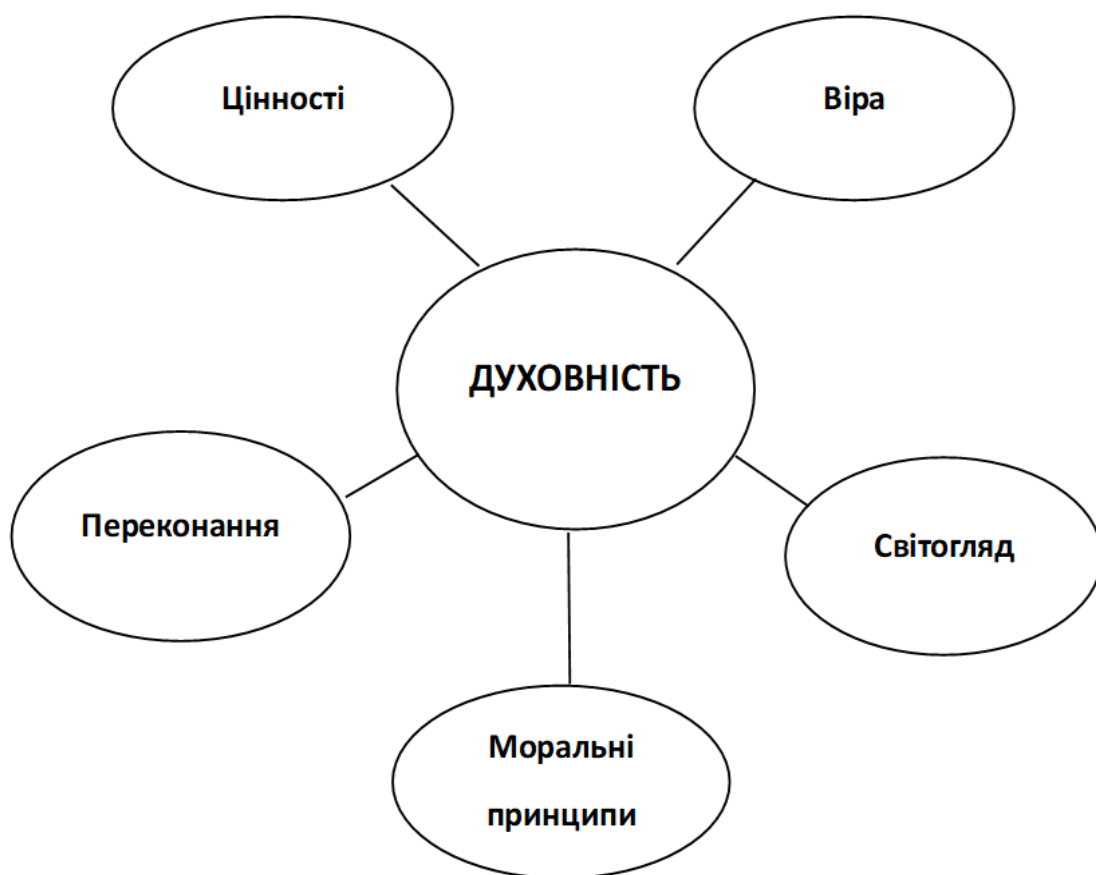
Рис. 1.4. Складові духовності

Духовність – це складова частина культури особистості, яка відображає внутрішній світ, її цінності, переконання, світогляд, моральні принципи та релігійні установки.