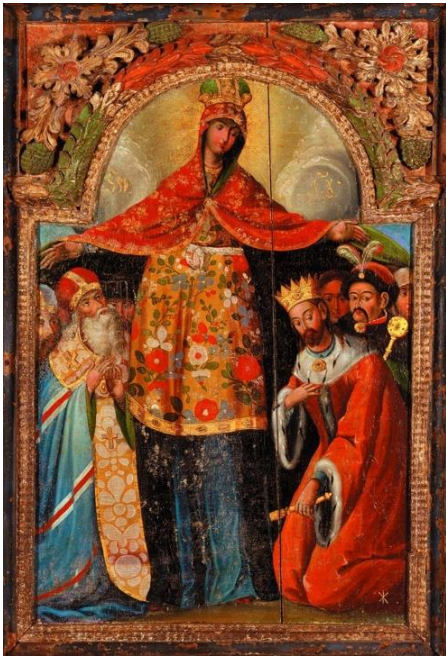
іл.1.1 "Покров Богородиці" із зображенням Богдана Хмельницького і архієпископа Лазаря. Барановича. Перша половина XVIII ст.