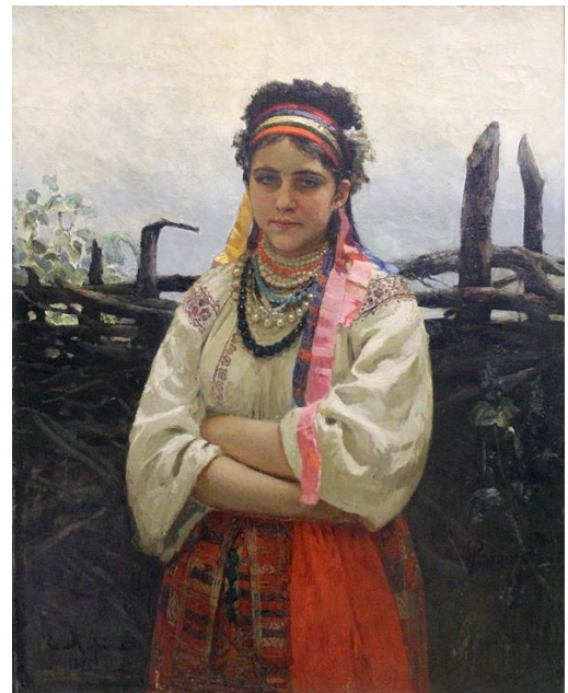
іл.1.4 Ілля Рєпін «Українка біля тину» 1876 р.