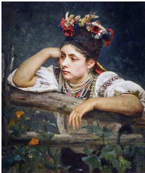
іл.1.3 Ілля Рєпін «Українка» 1875 р