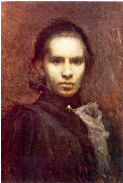
іл.1.5 Іван Труш «Портрет Лесі Українки» 1900 р.