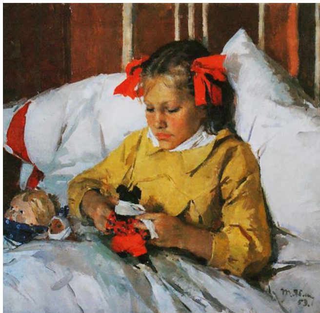
5.1. Тетяна Яблонська «Застудилася»