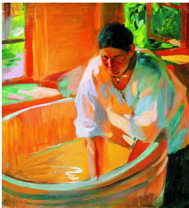
2.1. Олександр Мурашко «Праля»