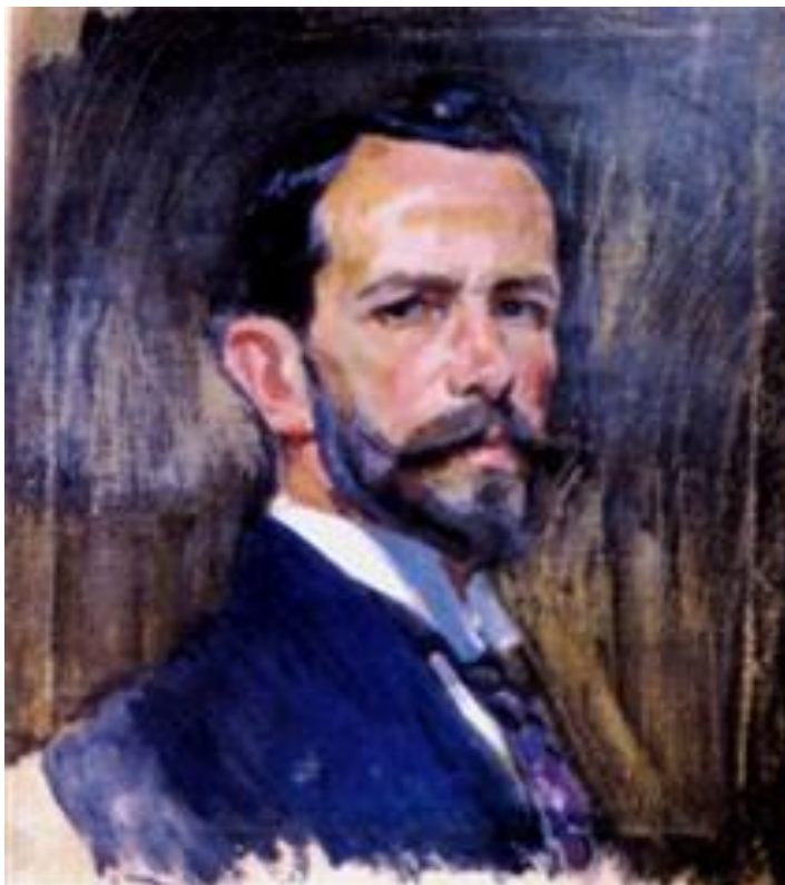
3.1. Олександр Мурашко «Автопортрет»