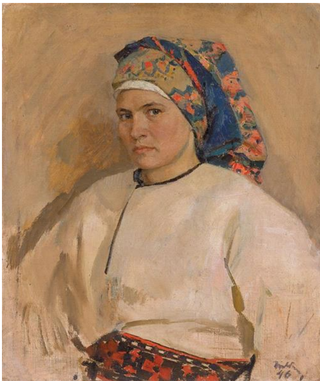
4.1. Тетяна Яблонська «Автопортрет в українському костюмі»