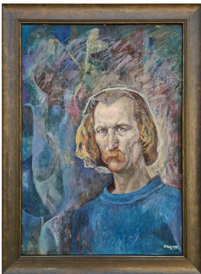
6.1. Іван Марчук «Автопортрет»