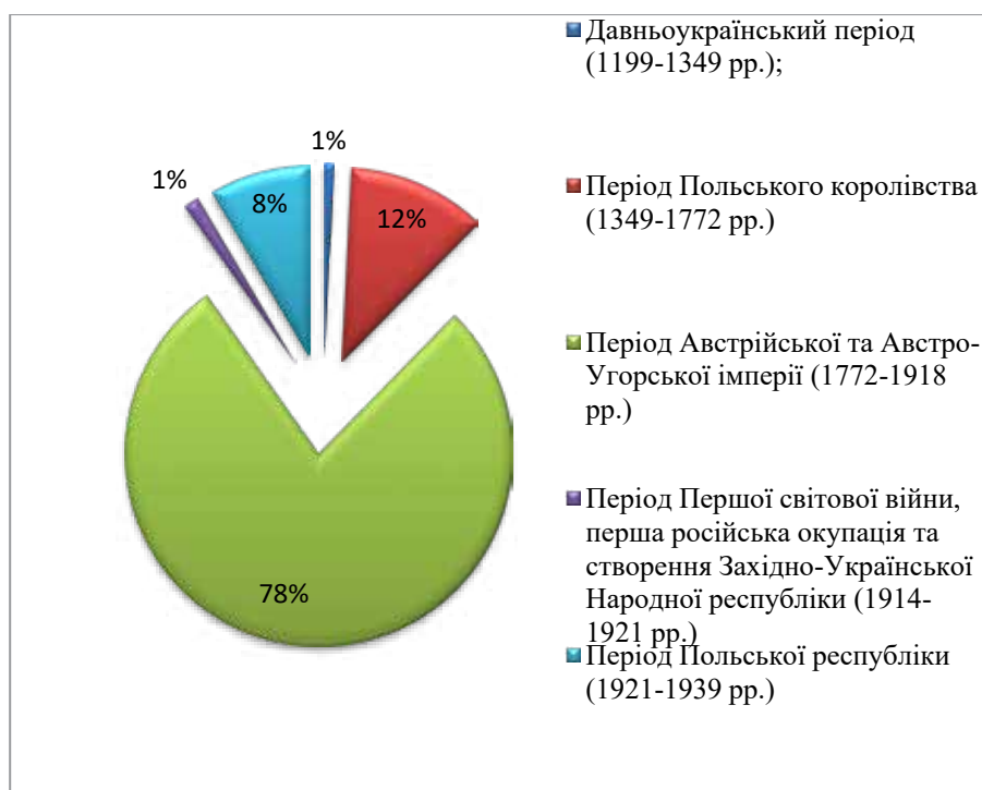
Рис. 2. Співвідношення кількості збудованих сакральних об'єктів Івано-Франківської області за періодами