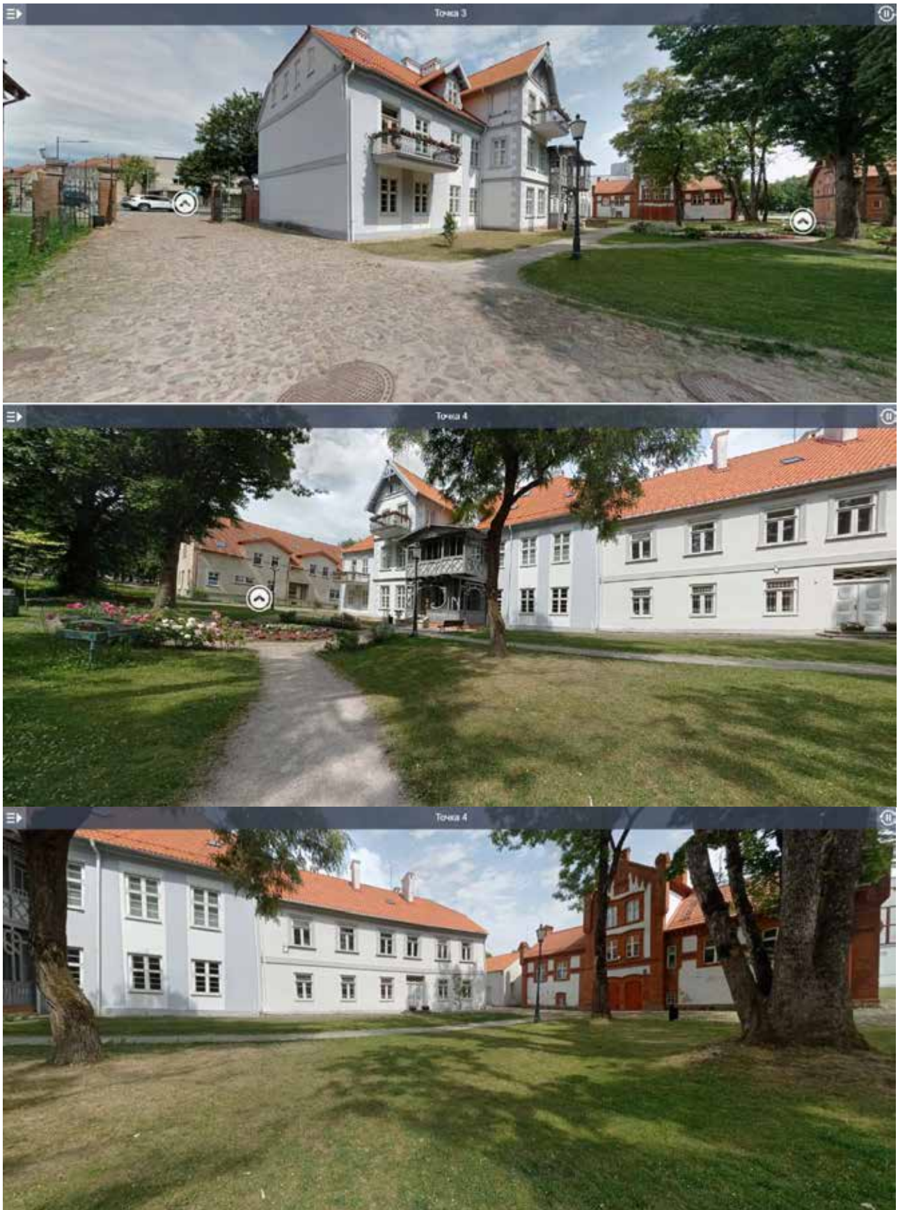
Рис. 2. Сцени з віртуального туру центром м. Шилуте у Литві (створила практикантка Т.О. Кудлай у 2022 р.)