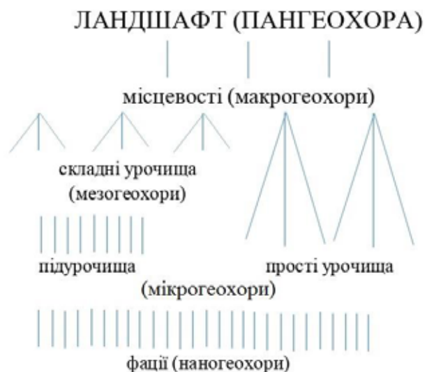
Рис. 1. Структура земного простору на субландшафтному рівні

В аналогічний спосіб формулюємо хоричні (просторові) відповідники на регіональному рівні горизонтальної диференціації ландшафтно оболонки Землі. Наголошуючи на нерозривному зв'язку між внутрішньоландшафтними та надландшафтними (тими, що складають класичну схему фізико-географічного районування) структурами, ми пропонуємо простір, зайнятий тим чи іншим індивідуальним ландшафтом, а також розташований над