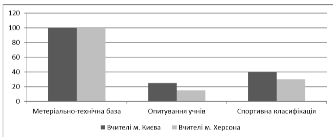
Рис. 2. Розподіл відповідей (%) щодо критеріїв вибору вчителів фізичної культури варіативних модулів

Також, важливим для нашого дослідження було з'ясувати за якими критеріями здійснюється вибір варіативних модулів, і що є визначальними факторами щодо їх вибору. Було поставлене запитання «Які фактори домінують при виборі варіативних модулів?» розподіл відповідей вчителів наочно представлено на рисунку 2.