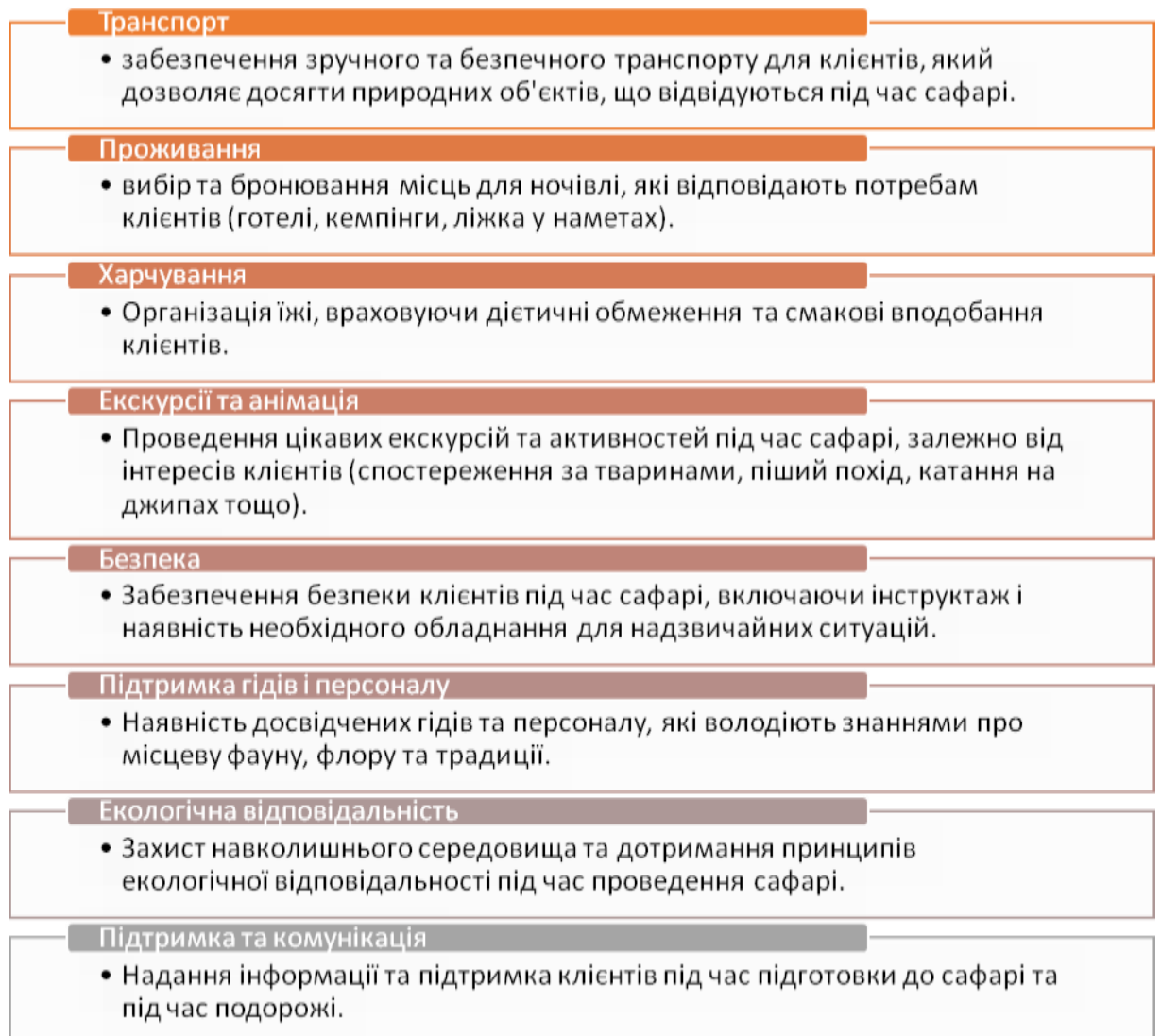
Рис. 2. Компоненти сервісного забезпечення сафари-турів

Сервісне обслуговування сафари-турів має бути добре організоване і відповідати нормативним вимогам і очікуванням клієнтів, щоб забезпечити їм незабутні враження від дикої природи (рис. 2). Також важливо дотримуватися принципів сталого туризму та екологічної відповідальності для збереження природних резерватів і біорізноманіття [2].