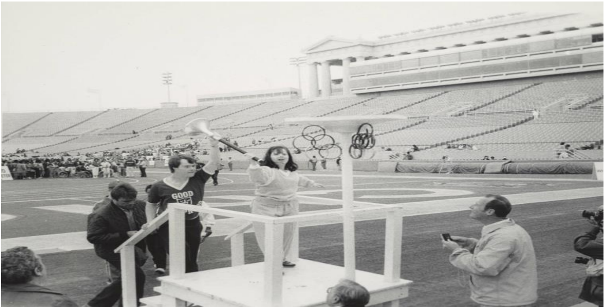
Рис. 1.3. Відкриття першої Спеціальної Олімпіади, Чикаго, США, 1968.

У грудні 1968 року було створено Міжнародну організацію Спеціальних Олімпіад (МОСО) – Special Olympics International для розумово-відсталих атлетів, яка за всю історію свого існування завжди була і лишається благодійною та неприбутковою організацією.