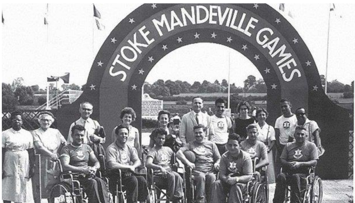
Рис. 1.2. Сток-Мандевільські ігри, Великобританія, 28 липня 1948 рік.

У наступні роки відбувалося постійне зростання кількості учасників змагань для інвалідів, а також діапазон видів спорту, які вони представляли. Саме тому в найближчі роки ця ідея проведення ігор для інвалідів швидко перетнула кордон Великобританії та стала не просто методом реабілітації, а повноцінним щорічним міжнародним фестивалем на дуже високому професійному рівні. З 1952 року такі Ігри проводяться за участю спортсменів-інвалідів із Нідерландів, Німеччини, Швеції, Норвегії.