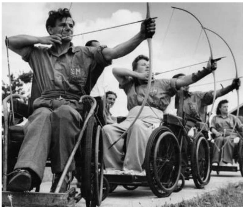
Рис. 1.1. Тренування зі стрільби з лука у Сток-Мандевільській лікарні.

З цією метою в лікарні Л. Гуттмана було першочергово введено тренування хворих зі стрільби з лука (рис. 1.1), а пізніше також з тенісу, плавання, баскетболу, настільного тенісу, волейболу, легкої атлетики, перегонів на візках, рукоборства тощо [4].