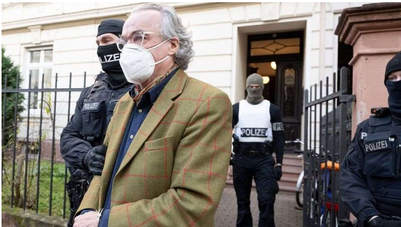
Фото: Під час рейду проти так званих «громадян Рейху» поліцейські ведуть принца Генріха XIII Ройса

Джерело: Ein 'Rädelsführer' und die 'Reichsbürger' in Thüringen [A 'Ringleader' and the 'Reichsbürger' in Thüringen]. Wirtschaftswoche Режим доступу: https://web.archive.org/web/20221208153648/http://www.wiwo.de/politik/deutschland/terrorismus-ein-raedelsfuehrer-und-die-reichsbuerger-in-thueringen/28854276.html