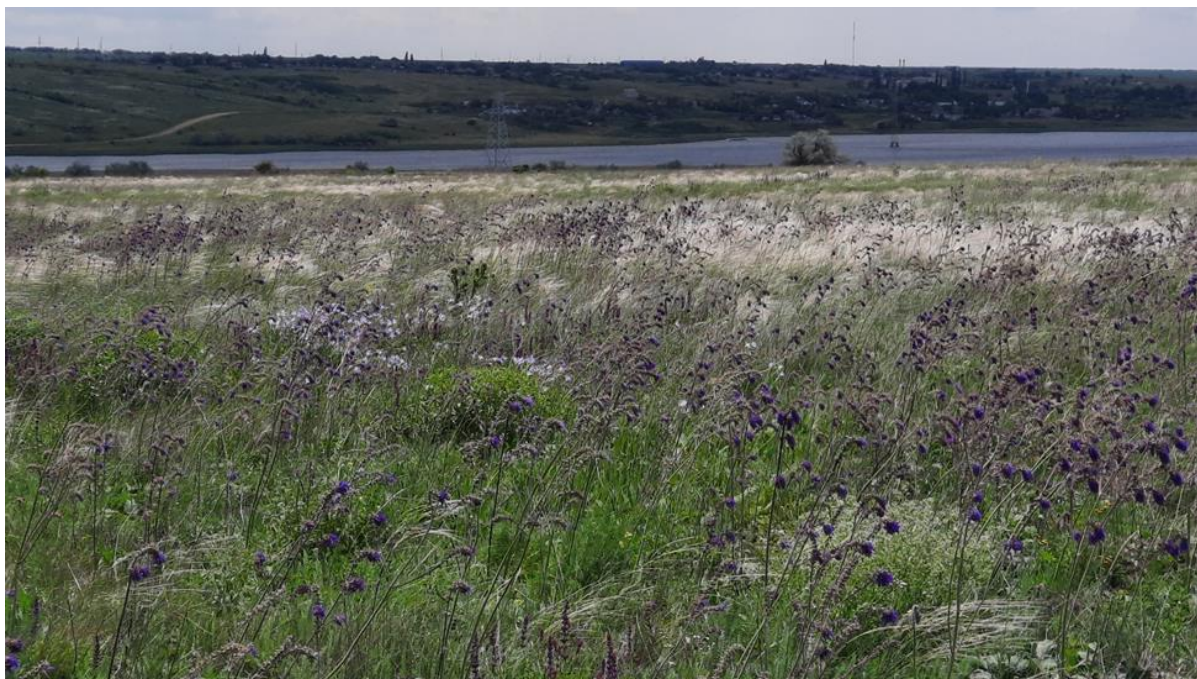
РИСУНОК 3. Загальний вигляд схилу Тилігульського лиману (весна 2023 року).