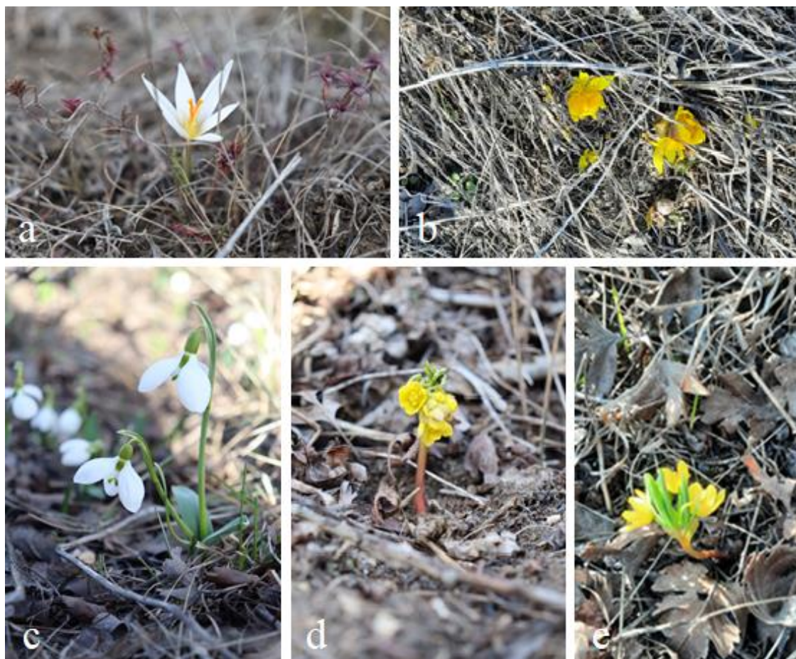
РИСУНОК 2. Рідкісні ефемероїди Регіонального ландшафтного парку «Тилігульський»: а – Crocus reticulatus ; б – Adonis vernalis ; с – Galanthus elwesii ; д, е – Gymnospermium odessanum .