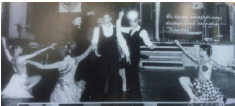
Борис Калініченко, видатний хореограф. URL: http://blog.i.ua/user/12267808/

Помер Борис Дем'янович Калініченко від серцевого нападу на 42 році життя 19 липня 1983 року.