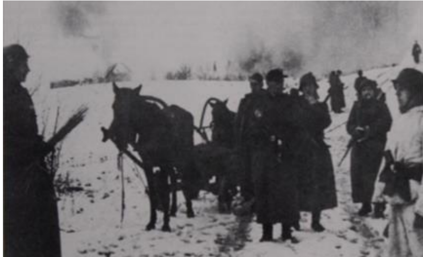
Фото 1. Німецькі військові, яким вдалося врятуватися з радянського котла.