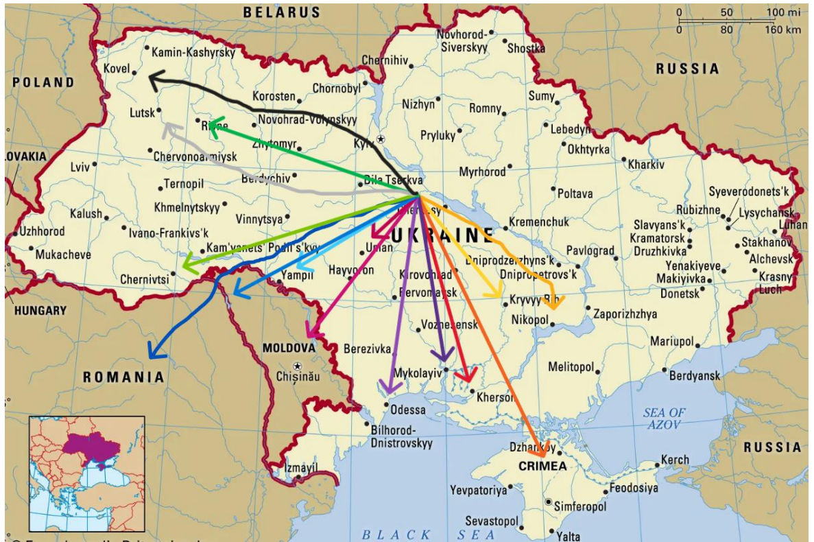
Карта 2. Наступи радянських військ після Корсунь – Шевченківської операції.