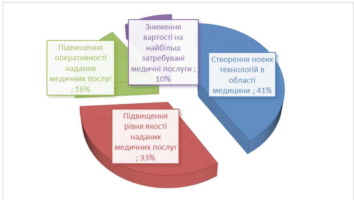
Рис. 1.3. Основні тенденції та фактори забезпечення зростання на ринку медичного туризму

В якості наочного прикладу, що характеризує тенденції і особливості розвитку ринку медичного туризму можна навести дослідження, проведене фахівцями Національного університету м. Цюрих щодо ключових драйверів зростання ринку медичного туризму (рис. 1.3).