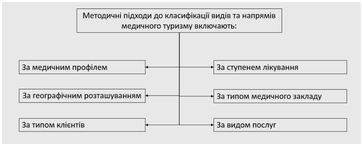
Рис. 1.2. Методичні підходи до класифікації видів та напрямів медичного туризму

методичних підходів до класифікації допомагає систематизувати та зрозуміти різноманіття цього виду туризму.