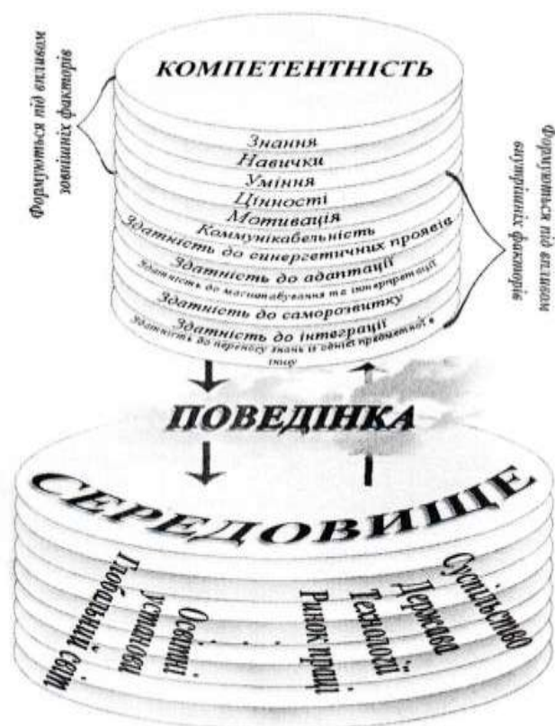
Рисунок 1.1 – Структура та складові компетентності

Мотивація, як бачимо з рисунка 1.1. [5, с. 4], є однією зі складових компетентності майбутнього фахівця.