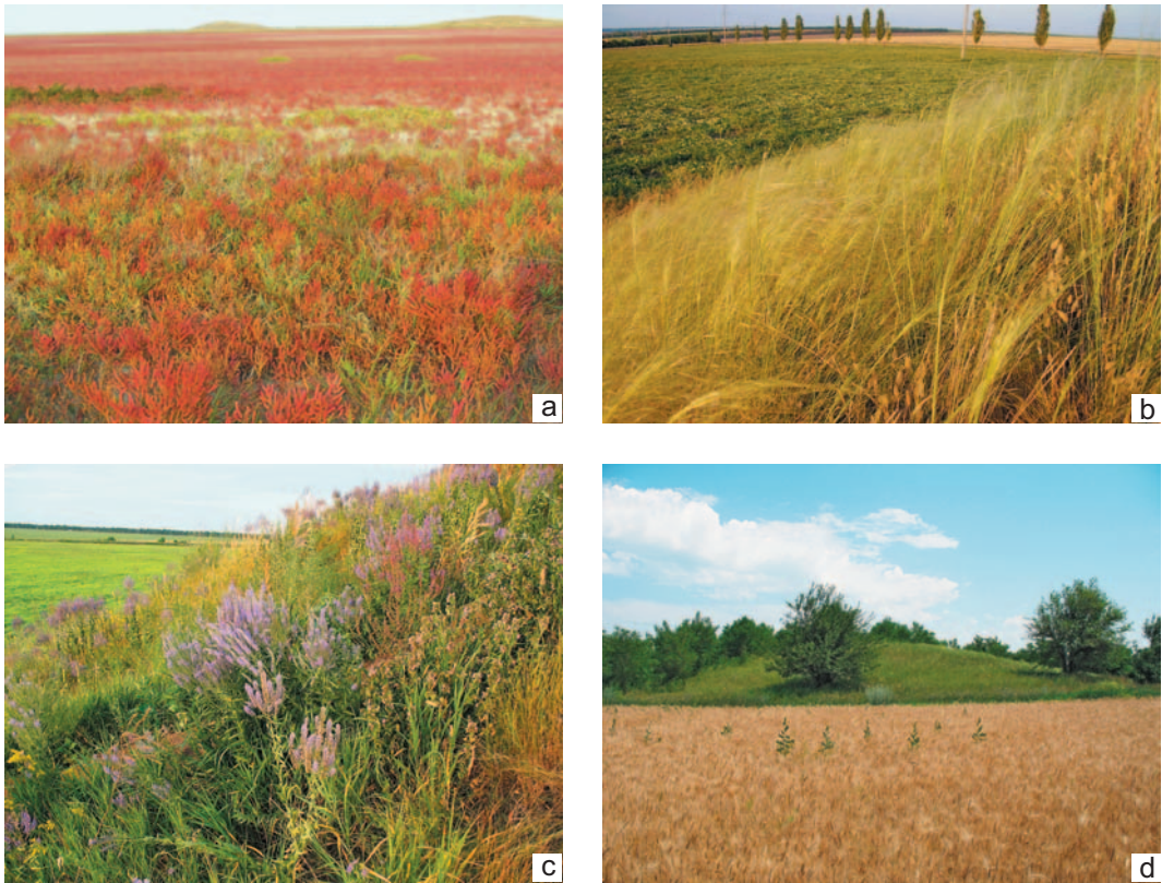
Ryc. 4. Przykłady kurhanów spełniających założone kryteria w krajobrazie: a) stepu piołunowego, b) stepu trawiastego w wariacie uboższym gatunkowo, c) stepu trawiastego w wariacie bogatym gatunkowo, d) w strefie lasostepu.

Fig. 4. Some examples of the kurgans which meet the proposed criteria in each of the climatic-vegetation zones: a) desert steppe zone; b) west Pontic grass steppe zone; c) Pontic herb(-rich) grass steppe zone; d) forest-steppe zone.