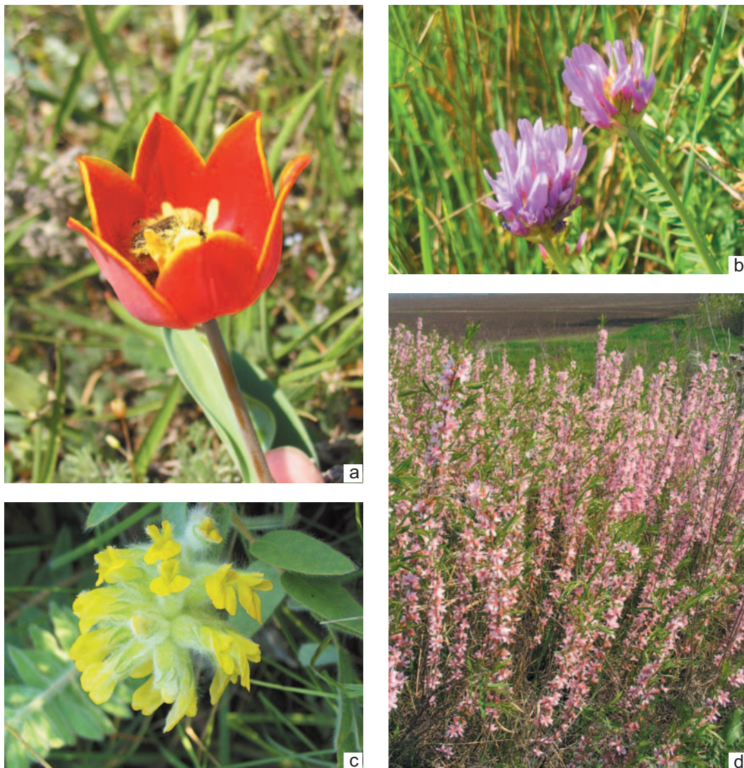
Ryc. 5. Najcenniejsze gatunki i zbiorowiska roślinne na kurhanach: a) Tulipa shrenkii Regel, b) Astragalus borysthenticus Klokov, c) A. dasyanthus Pall., d) Amygdaletum nani.

Fig. 5. The most valuable species and plant communities on kurgans: a) Tulipa shrenkii Regel, b) Astragalus borysthenticus Klokov, c) A. dasyanthus Pall., d) Amygdaletum nani.