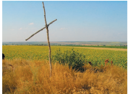
Ryc. 1. Niektóre kurhany pełniące do dziś rolę cmentarzy.