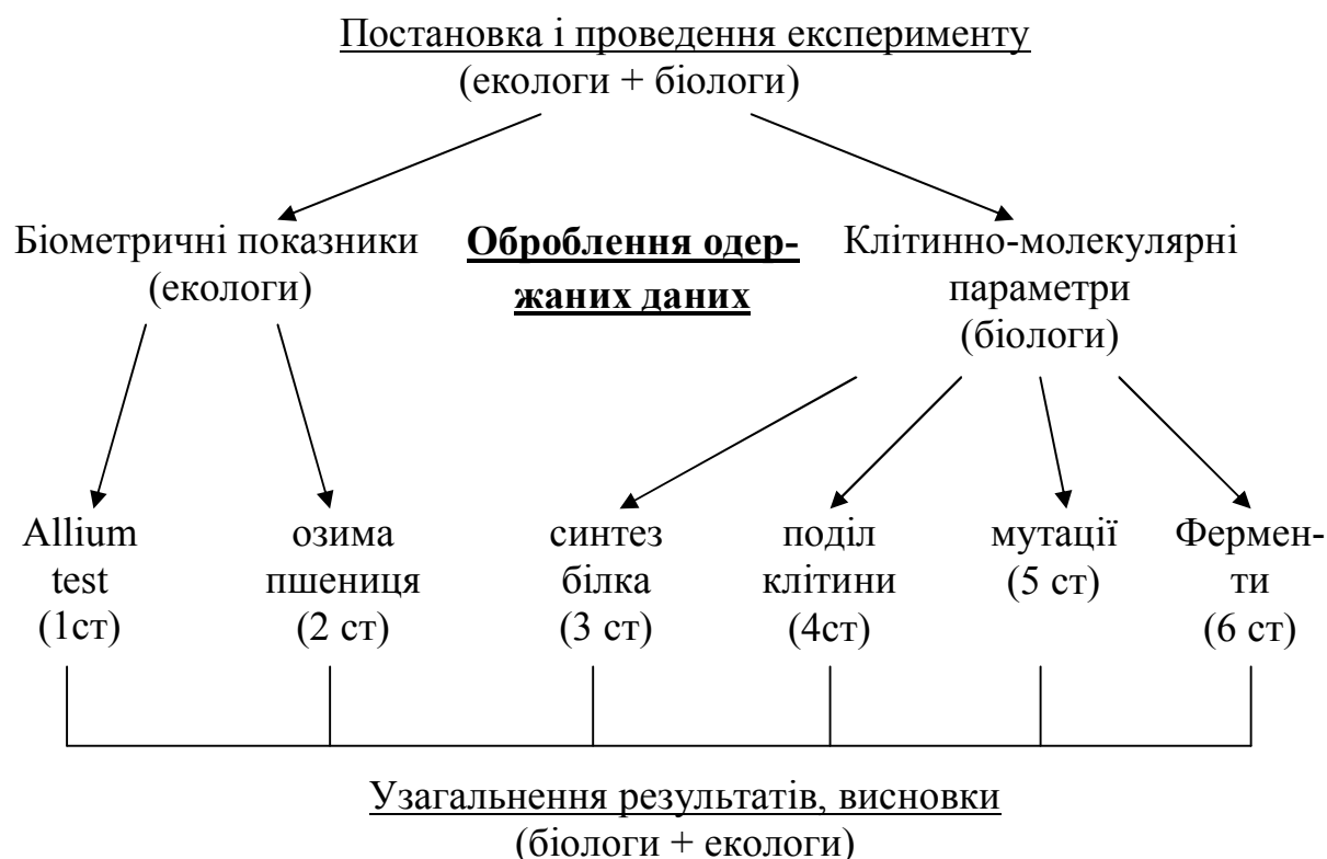
Рис. 2. Схеми організації проведення дослідження пошуковою групою студентів («біологів» + «екологів»).

Тема: Визначення біологічних властивостей синтетичного стимулятора росту засобами біотестування