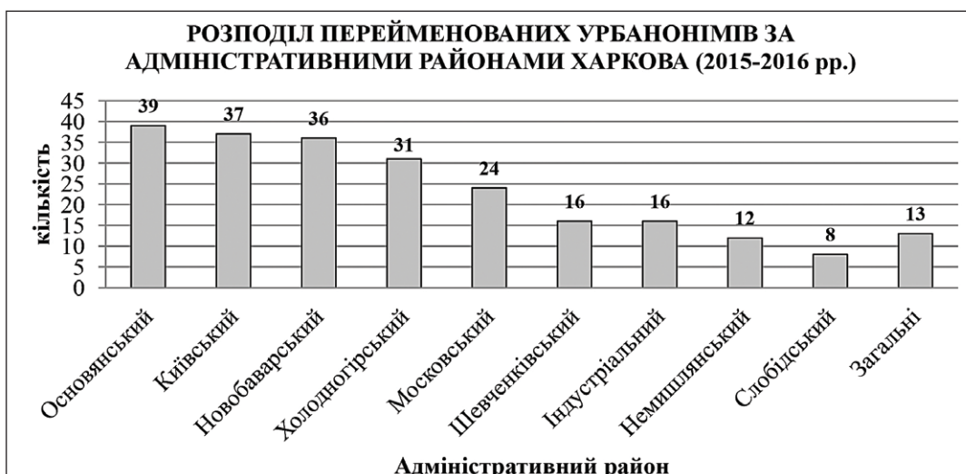
Рис. 2. Розподіл перейменованих урбанонімів за адміністративними районами м. Харкова (2015–2016 рр.)