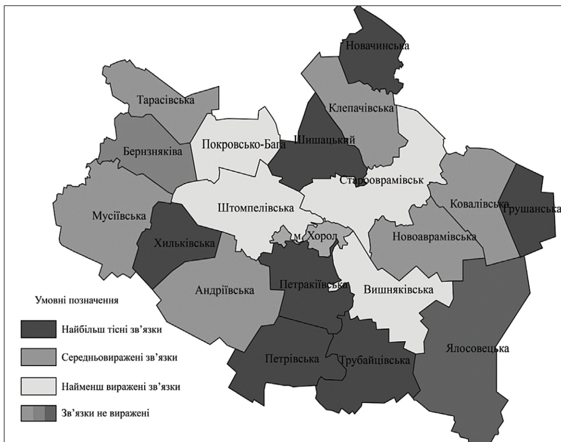
Рис. 3. Кластерні зв'язки сільських рад Хорольського району за соціально-демографічним розвитком (розраховано та побудовано за даними [5, 6])

Найбільш подібні між собою Грушанська, Новачинська, Хильківська, Петраківська, Трубайцівська, Петрівська, Шишаківська сільські ради. Це сільські ради з низькими показниками народжуваності та високими показниками смертності, а також із високою часткою населення старше 65 р., тому має місце значне демографічне навантаження цією віковою групою на населення працездатного віку. Тарасівська, Ковалівська, Мусіївська, Клепачівська,