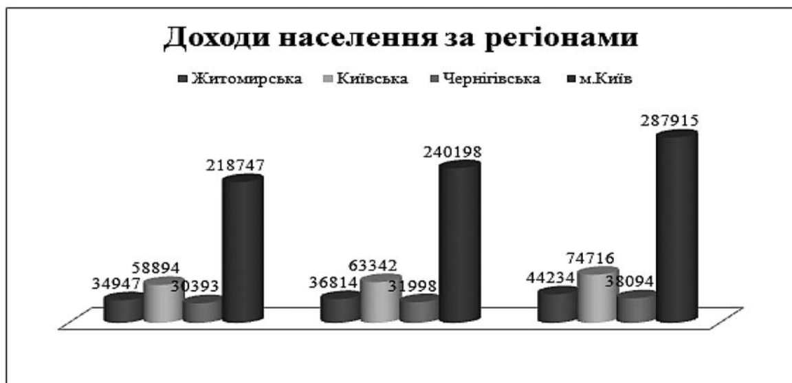
Доходи (млн. грн.)

Таким чином, результати аналізу доходів населення за регіонами Столичного макрорайону України демонструють динаміку збільшення, що зумовлено внутрішньо- та зовнішньоекономічними умовами України, а також чинниками в межах регіонального поділу. Виходячи з показників доходу населення за регіонами Столичного макрорайону України, найвище значення має м. Київ, його показники протягом досліджуваного періоду характеризуються динамікою збільшення. На другому місці після столиці серед інших регіонів знаходиться Київська область, а Чернігівська область має низький показник в Столичному макрорайоні України. Переконливим індикатором для віднесення осіб до представників середнього класу є врахування матеріального становища населення територіальної одиниці, а дохід як фактор