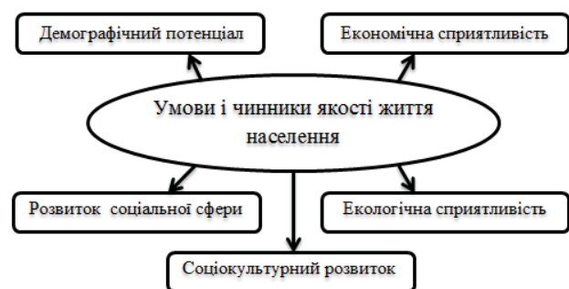
Рис. 1. Складники умов та чинників ЯЖН

Сукупність умов і чинників ЯЖН було розділено на 5 груп: демографічний потенціал, соціальний та соціокультурний розвиток, економічна та екологічна сприятливість (рис. 1).