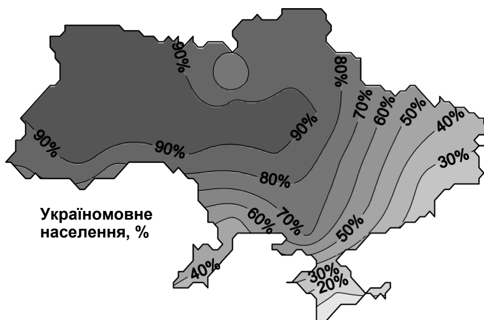
Мал. 1. Географічні особливості розміщення україномовного населення в Україні (на 2001 р.).

Просторовий розподіл україномовного і російськомовного населення методом псевдоізоліній показано на малюнках 1 і 2.