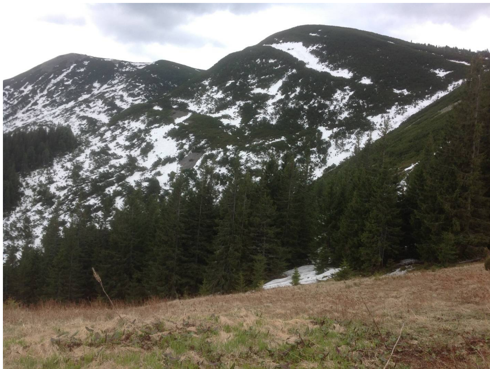
Рис. 2. Загальний вигляд на г. Полєнський в природному заповіднику «Горгани».